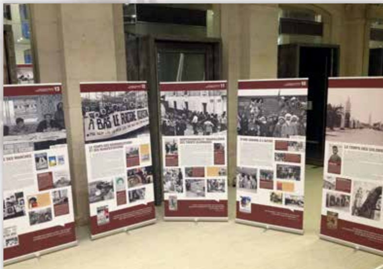
Mairie de Paris