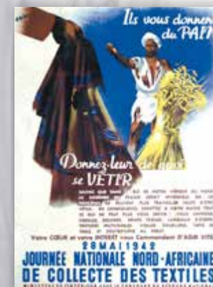
Journée nationale nord-africaine de collecte des textiles, affiche, 1942.