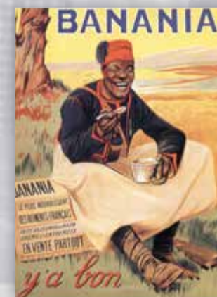
Banania y'a bon, carton publicitaire, 1915.