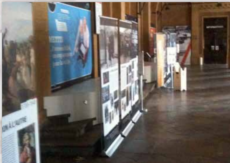
Les rendez-vous de l'histoire, Blois