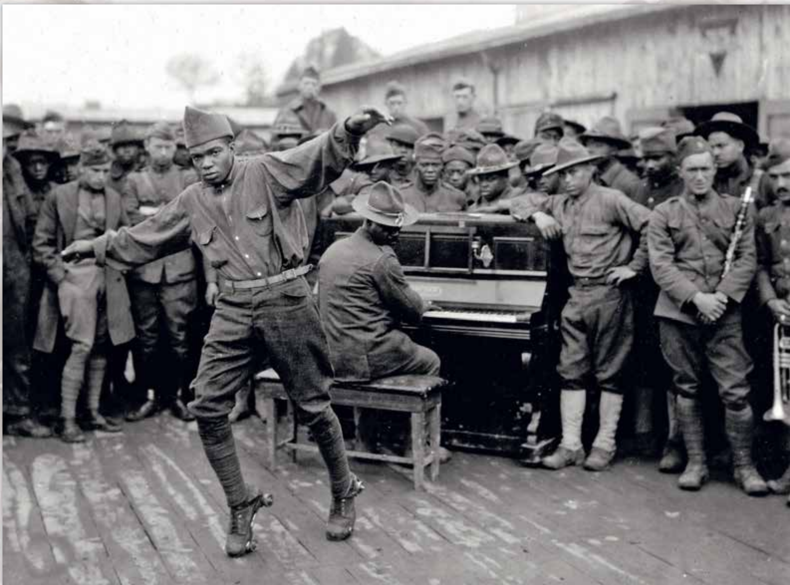
Entertaining the boys with fancy dancing on roller skates [Bordeaux], 1918.