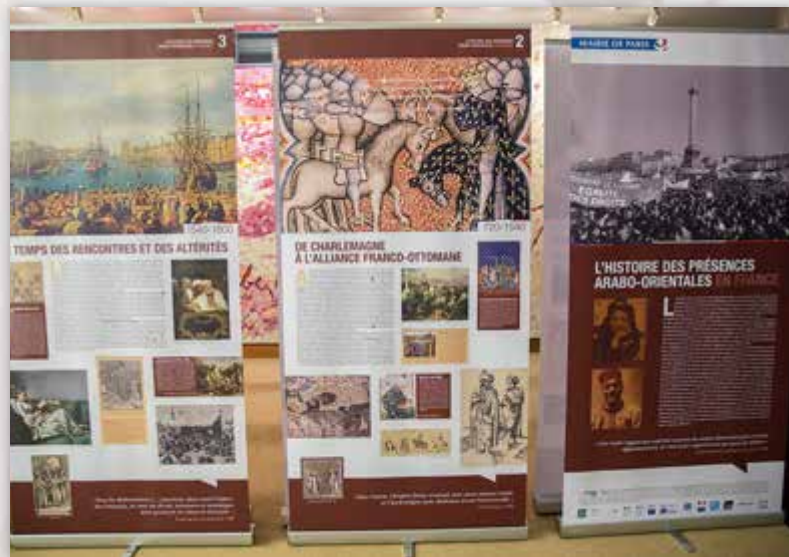
Palais du Luxembourg, Paris