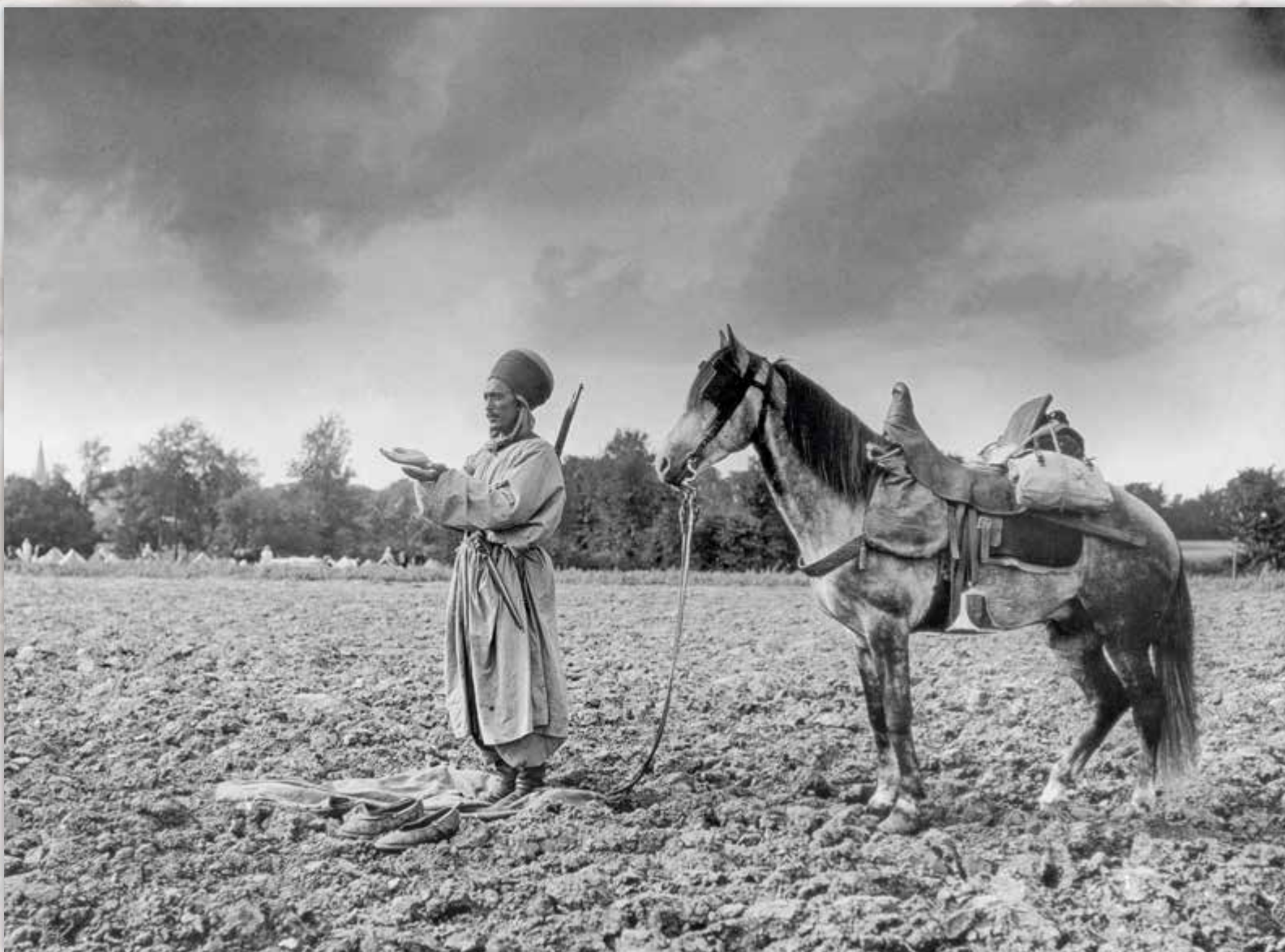
Prière d'un Spahi algérien en guenhour (la coiffe) et gandourah (la tenue) [Oise], photographie, 1916.