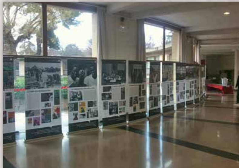
Médiathèque de Montpellier