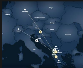
Origine des joueurs de l'équipe d'Albanie