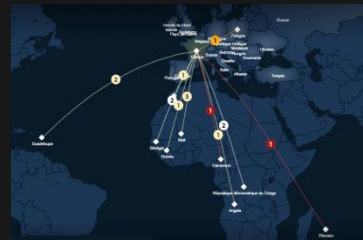
Origine des joueurs de l'équipe de France issus de la diversité

L'occasion de rappeler que le site internet Netbet revient, à travers une cartographie, sur le multiculturalisme de cet Euro 2016. Ce soir, l'équipe de France, la plus multiculturelle du championnat avec 65% issus de l'immigration, affronte l'équipe d'Albanie, numéro trois au « classement de la diversité » (selon l'Université de Dulles) avec 57% de joueurs issus de l'immigration. Des chiffres forts qui révèlent des immigrations pourtant bien différents pour chacun de ces pays.