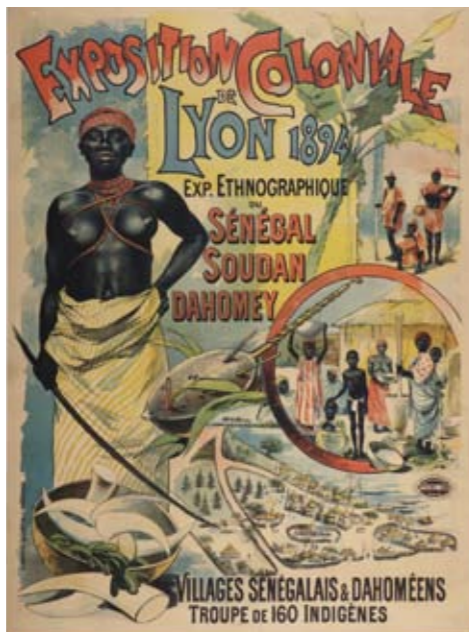
Exposition coloniale de Lyon, 1894

Ce colloque international, organisé en collaboration avec la Fondation Lilian Thuram Éducation contre le racisme, le CNRS et le Groupe de recherche Achac, s'inscrit dans le prolongement des colloques précédents sur les exhibitions ethnographiques et coloniales, organisés à Marseille en 2001 (3 journées) et à Londres en 2008 (1 journée), et préfigure les étapes suivantes qui se tiendront à l'Université de Lausanne en mai 2012 (2 journées) et à Los Angeles en 2014 (4 journées).