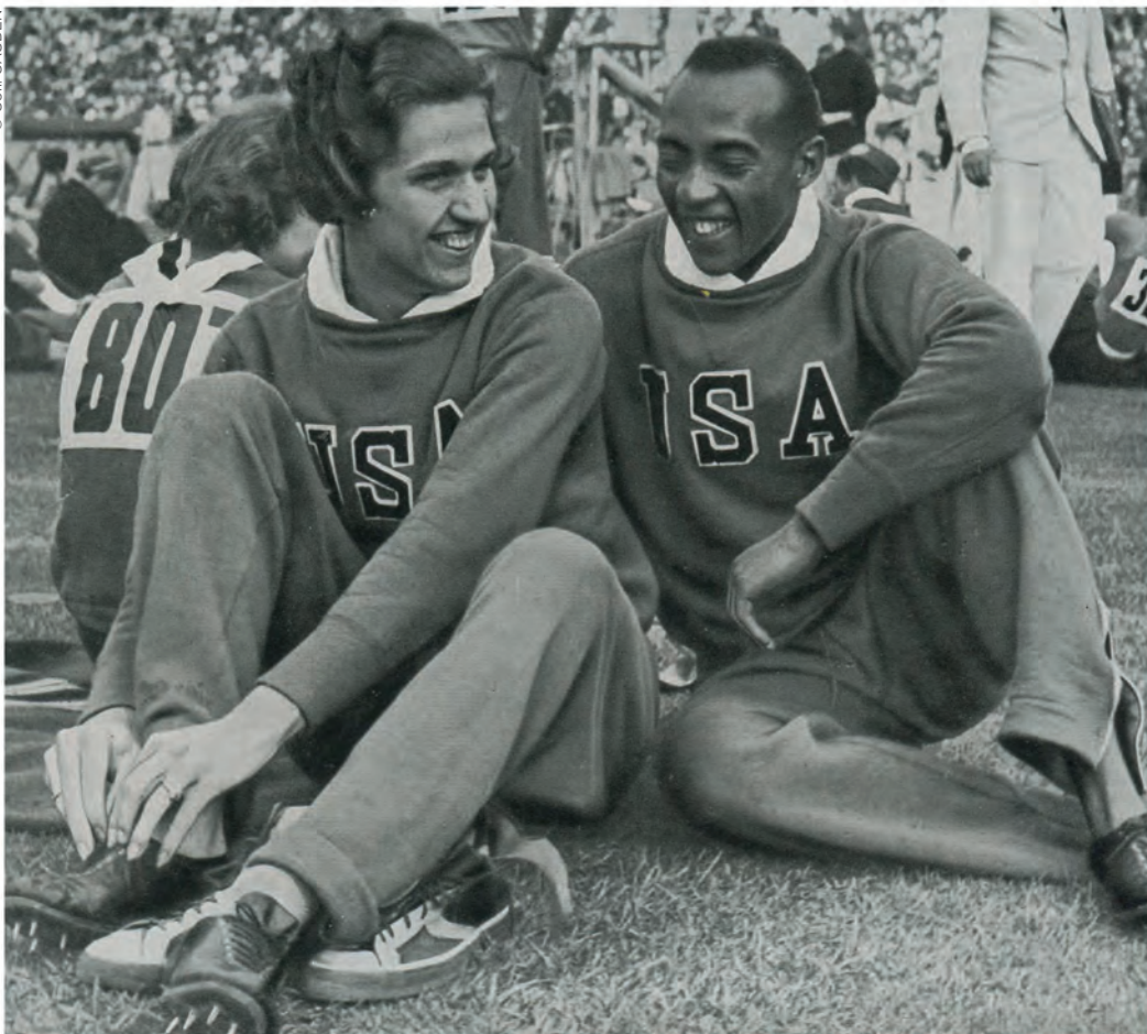
Helen Stephens et Jesse Owens, Berlin, 1936.