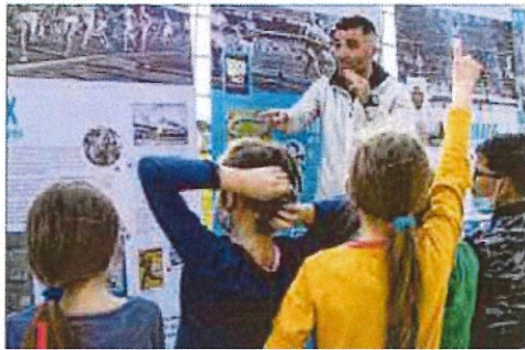
Une jeune équipe attentive sur les valeurs du sport et son histoire.