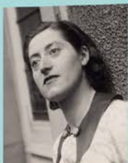
Lucie Aubrac, photographiée en 1944

Lucie Aubrac naît à Paris le 29 juin 1912 et manifeste très tôt un engagement militant. Lucide face à la montée des fascismes en Europe, cette professeure agrégée refuse dès juin 1940 l'écuse de la défaite. Aux côtés de son mari, Raymond Aubrac, elle participe à la création des premières structures du mouvement Libération-Sud. Très investie, elle prend part à toutes les actions. En octobre 1943, au cœur de Lyon, elle organise une spectaculaire opération qui permet de libérer son époux et treize autres résistants des mains de la Gestapo, quelques mois après leur arrestation à Caluire, le 21 juin, aux côtés de Jean Moulin et d'autres figures de la Résistance. Désormais activement recherchée par les autorités allemandes, elle quitte la France avec Raymond et leur enfant le 8 février 1944 pour rejoindre Londres. Surnommée « Madame Conscience », elle reprend son métier d'enseignante à la Libération. Plus tard, elle sillonne la France pour transmettre aux jeunes générations l'histoire de la Résistance, l'importance de la lutte contre les totalitarismes, et la nécessité de défendre les acquis sociaux issus de la Libération. Elle s'implique également au sein d'Amnesty International et dans le réseau Femmes pour la parité.