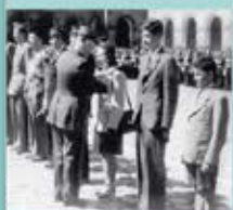
22 volontaires du Corps féminin des transmissions, photo prise au camp de Fontenay-sous-Forges, 1943.