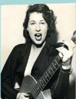
Anna Marly, chanteuse et guitariste, 1943

Anna Marly naît en Russie le 30 octobre 1917, au cœur de la Révolution russe. Exilée en France avec sa famille dans les années 1920, elle débute une carrière de danseuse au sein des ballets russes avant de devenir chanteuse dans les cabarets parisiens. En mai 1940, face à l'exode, elle quitte la France pour Londres où elle s'engage comme cantinière dans les Forces françaises libres. C'est là qu'elle compose à la guitare la mélodie du Chant des partisans , dont les paroles sont écrites par Joseph Kessel et son neveu Maurice Druon. Rapidement, cette chanson devient l'hymne de la Résistance française, incarnant le volonté d'un peuple refusant la défaite et prêt à se battre. Utilisé comme signature sonore de l'émission de la BBC Jeuneur et Patrie et comme signal secret dans les réseaux, le Chant des partisans connaît une portée internationale. Après la guerre, Anna Marly voyage avant de s'établir aux États-Unis. Le 18 juin 2000, à l'occasion du 60 e anniversaire de l'appel du 18 juin, elle revient en France pour interpréter ce chant à l'église de la Madeleine. Sa musique demeure à jamais le symbole de cette période de combat.