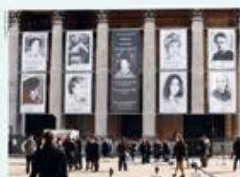
Portraits de neuf résistantes françaises célèbres, dont Charlotte Delbo, en haut à gauche, sur la façade du Palais de la République de la Ville de Paris lors de l'exposition "Résistantes et combattantes" (Paris)

Marie-Claude VAILLANT-COUTURIER (1912-1996) Charlotte DELBO (1913-1985)