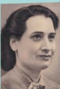
Danielle Casanova, photo/photographie, 1939

Danielle Casanova, née Vincetella Perini le 9 janvier 1909 à Ajaccio en Corse, reprend des études dentaires à Paris avant de s'engager très jeune dans l'Union fédérale des étudiants. Adhérente aux Jeunesses communistes dès 1928, elle rencontre et épouse Laurent Casanova en 1933. Très active dans les cercles communistes parisiens, elle crée en 1936 l'Union des jeunes filles de France, mouvement antifasciste. Lorsque le Parti communiste français est interdit en septembre 1939, elle entre dans le clandestin, où elle s'attache d'abord à rétablir les liens entre militants et dirigeants du PCF. Dès 1941, elle contribue à organiser une structure armée et des comités féminins pour protester contre les restrictions. Arrêtée le 15 février 1942, elle passe plusieurs mois à la prison de la Santé sans renoncer à son engagement. Déportée à Auschwitz-Birkenau le 24 janvier 1943 avec plus de 200 femmes, elle assure un temps les soins médicaux dans son block et crée des liens avec la Résistance clandestine, avant de succomber au typhus le 9 mai 1943.