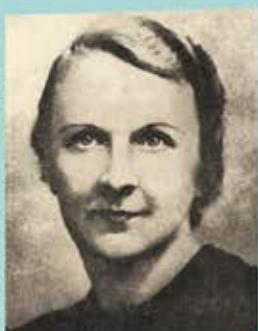
Berty Albrecht, infirmière au début des années 1920, puis résistante (Photo : photographie, 1943)

Berty Albrecht, née le 15 février 1893 à Marseille, a consacré sa vie à la lutte et à l'engagement. Infirmière durant la Première Guerre mondiale, elle s'investit ensuite dans le mouvement féministe des années 1920, défendant notamment la contraception et le droit des femmes à accéder à des postes de direction dans l'industrie. À la fin des années 1930, elle organise l'accueil d'artisans allemands et de brigadistes internationaux fuyant les régimes totalitaires. Dès la fin 1940, elle rejoint la Résistance encore naissante et, à l'automne 1941, elle cofonde avec Henri Frenay le mouvement Combat. Elle y joue un rôle clé en collectant des informations et en dirigeant le service social chargé d'aider les résistants en fuite ainsi que les familles des emprisonnés ou évacués. Arrêtée en novembre 1942 et internée en Ardèche, elle réussit à s'évader pour rejoindre la Sabne-et-Loire où elle prend part à la lutte armée. Elle est arrêtée par le Gastaou à Mâcon le 27 mai 1943. Torturée, puis transférée à la prison de Fresnes, elle y trouve la mort dans des circonstances restées obscures. Le 26 août 1943, elle est honorée comme l'une des six femmes Compagnes de la Libération. Son corps repose dans la crypte du mémorial de la France combattante au Mont-Vaérien, en hommage aux combattantes de la première heure.