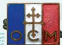
OCM (Organisation civile et militaire), logo du Mouvement de la Résistance, c. 1940