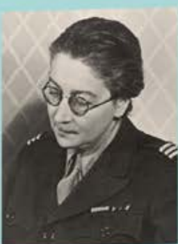
Rose Valland, membre de la Résistance, après l'occupation, photographié en 1945.

Née le 1 er novembre 1898 dans l'Isère, Rose Valland est une figure majeure de la restitution des œuvres d'art volées pendant la Seconde Guerre mondiale. Durant l'Occupation, les nazis mettent en place un véritable pillage des musées et des collections privées, notamment celles appartenant à des familles juives déportées ou contraintes de fuir la France, utilisant le musée du Jeu de Paume comme lieu de stockage principal. Employée comme attachée de conservation dans ce musée, Rose Valland réalise un inventaire précis des œuvres dérobées et transmet des informations cruciales à la Résistance concernant les déplacements de ces pièces. À la libération de Paris en août 1944, elle intègre la Commission de récupération artistique. Son rôle essentiel dans la sauvegarde de près de 45 000 œuvres est célébré dans le film Le Walk de John Frankenheimer (1964), tandis que son portrait a aussi inspiré le personnage de Claire Simone dans Monuments Men de George Clooney (2014). Après la guerre, elle contribue à la restauration des musées allemands et se voit décorer en 1972 la croix d'officier de l'ordre du Mérite de la République fédérale d'Allemagne en reconnaissance de ses services dans le domaine des arts.