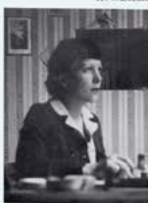
Simone Michel-Lévy à son bureau (Paris), photographie, non datée