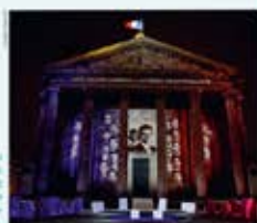
Cérémonie d'entrée au Panthéon de Missak et Melinee Manouchian et du groupe Manouchian (Paris), 2024.

« Je meurs avec la conscience tranquille et avec toute la conviction que demain tu auras une vie et un avenir plus heureux que ta mère. »