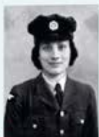
Noor Inayat Khan, photographie, 1943

Neuf espionnes étrangères au service de la Libération Anna MARLY (1917-2006)