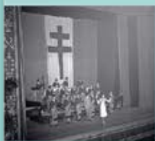
Le commandement des Forces armées françaises en Afrique du Nord, 1943.

Josephine BAKER (1906-1975) « Huit « combattantes », aviation et information