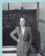
Gilberte Brossolette, femme de la France (collaboration), mariage de la presse française, 1944.

Gilberte Brossolette voit le jour le 27 décembre 1905 à Paris, dans une famille républicaine engagée. Elle devient institutrice puis journaliste, et milite très tôt pour les droits des femmes et la justice sociale. En 1920, elle épouse Pierre Brossolette, futur journaliste et résistant de renom, avec qui elle partage des idées socialistes et républicaines. Lorsque la Seconde Guerre mondiale éclate, et après l'invasion de la France par les troupes allemandes en 1940, elle s'engage dans la Résistance aux côtés de son mari. Elle joue un rôle essentiel en tant qu'agent de liaison. Après l'arrestation et la mort de son mari en 1944, torturée par le Gestapo, elle continue la lutte, refusant de céder à la terreur nazie. À la Libération, elle honore la mémoire de son mari et s'engage dans la transmission du devoir de mémoire auprès des jeunes générations. Nommée au Conseil de la République en 1946, elle est élue sénatrice de la Seine en 1946. Vice-présidente du Sénat de 1946 à 1954, elle est la première femme à avoir présidé une réunion de la Haute Assemblée. Défendant résolument les idéaux républicains et les valeurs de la Résistance, elle milite également pour les droits des femmes et l'égalité sociale. Elle s'extingue en 2004, après avoir mené près d'un siècle de luttes en faveur des femmes, et de la liberté.