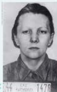
Simone Michel-Lévy (Simone Veil), photographée, 1944