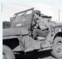
Ambulance Dodge et sa cabane de la Jeep à Ecouis, le 17 septembre 1944 (photogramme, 1944)