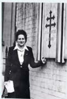
Émilienne Moreau-Évrard, photographée, 1944.

Émilienne Moreau-Évrard est née le 4 juin 1898 à Wingles, dans le Pas-de-Calais. Après la mort de son père en décembre 1914, elle ouvre une école clandestine pour les enfants de Loos, alors occupée par les Allemands. En 1918, elle se distingue en fournissant des informations cruciales aux troupes britanniques sur les positions ennemies, ce qui contribue à la reprise de la ville. Elle organise un poste de secours chez elle, soignant les blessés pendant les combats. Ses actions lui valent de nombreuses décorations, dont la Croix de Guerre et la Military Medal. Après la guerre, elle devient institutrice et s'engage activement dans le mouvement socialiste. Avec son mari, elle participe à la Résistance dès 1940, distribuant des tracts et fournissant des renseignements. Sous les pseudonymes de « Jeanne Poirier » et « Émilienne la Blonde », elle travaille pour le réseau Brutus, où elle établit des liaisons avec la Suisse. Traquée par les Allemands, elle réussit à échapper à plusieurs arrestations. Elle est finalement évacuée à Londres en août 1944, elle intervient alors pour la propagande alliée sur les ondes de la BBC et revient en France en septembre. Décorée de la Croix de la Libération par le général de Gaulle, elle reste active en politique jusqu'en 1963. Émilienne Moreau-Évrard décède le 5 janvier 1971 à Lens.