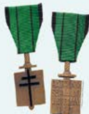
« Madame Conscience » : elle sauvera la parole, et la partagera au village. Croix de la Libération et Légion d'honneur, médaillés post mortem, 1943