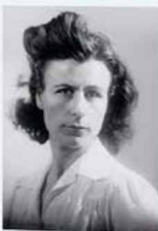
Mélinée Manouchian, 1943, photographie, 1943.

Mélinée Assadourian, née le 13 novembre à 1913 à Constantinople (Istanbul, Turquie), est l'épouse de Missak Manouchian. Immigrée arménienne, son parcours est indissociable de celui de son époux. Passé dans la clandestinité en juin 1941, le couple s'engage dans la lutte armée en 1943 au sein des FTP-MOI communistes. Mélinée Manouchian agit comme agente de liaison pour son mari. Leur groupe mène de nombreuses actions dont l'exécution du SS Julius Ritter. Le 16 novembre 1943, Missak Manouchian et ses compagnons sont arrêtés, mais Mélinée Manouchian échappe à la capture en trouvant refuge chez la famille Aznavourian. Missak Manouchian est fusillé avec 22 autres résistants le 21 février 1944 au Mont-Valérien. Mélinée Manouchian poursuit son engagement dans la résistance communiste jusqu'à la Libération. Elle devient ensuite française et se consacre à la mémoire des martyrs du groupe Manouchian jusqu'à sa disparition en 1989.