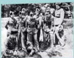
« Résistantes à l'issue de la Seconde Guerre mondiale, elles résistent, chacune à leur manière... »