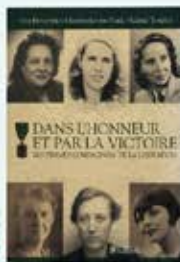
« Dans l'honneur et par la victoire. Les femmes Compagnes de la Libération », couverture de Catherine Lecomte, 2008