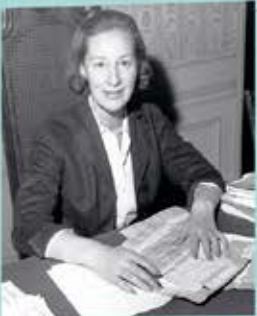
Marie-Madeleine Fourcade, photographée en 1944