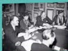
Suzanne Lacore et Cécile Brunschwig, en conseil des ministres au Palais de l'Élysée (Paris), photographie de presse, 1936.

Née le 6 mars 1901 à Marseille dans une famille bourgeoise, Germaine Poinso-Chapuis est élevée dans un milieu socialisé dans la culture des droits des enfants. Proche de Gaston Defferre, elle s'engage activement en politique au sein du Parti démocratique populaire, défendant des valeurs sociales et féminales. Durant la Seconde Guerre mondiale, elle rejoint la Résistance et participe au mouvement de Libération nationale, menant des actions clandestines contre l'occupant. Après la Libération, en 1945, elle est élue députée des Bouches-du-Rhône, devenant l'une des premières femmes à siéger au Parlement français. En 1947, elle est nommée ministre de la Santé publique et de la Population, occupant cette fonction jusqu'en 1948. Elle devient ainsi la première femme ministre de plein exercice dans l'histoire de la République, restant la seule jusqu'à la nomination de Simone Veil en 1974. Reconnue pour son engagement en faveur des droits des femmes et des familles, elle s'investit dans des politiques sociales et de santé. Germaine Poinso-Chapuis débute le 20 février 1983, la start-up un héritage à gref-catif dans la lutte pour l'égalité et la justice sociale en France.