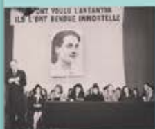
Danielle Casanova à la cérémonie commémorative de la Résistance à la Santé (Paris), photo/photographie, 1943

Danielle CASANOVA (1909-1943) Neus CATALÀ I PALLEJÀ (1915-2019)