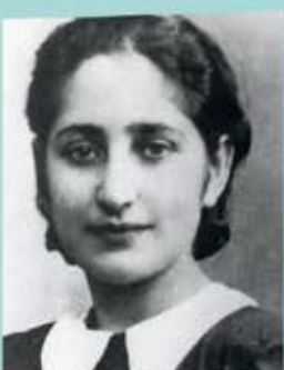
Olga Bancic, 1943, photo de presse, sans légende.

Olga Bancic est née en 1912 en Roumanie, dans une famille juive originaire de Besarabie. Militante active au sein des Jeunesses communistes et des syndicats, elle s'engage dès 1933 dans les combats antifascistes. Après plusieurs arrestations, elle s'exile en France en 1938, où elle se rapproche des milieux républicains espagnols. Après l'occupation, en 1940, elle participe à des actes de sabotage isolés avant de rejoindre, en 1943, le groupe Francs-tireurs et partisans – Main-d'œuvre immigrée (FTP-MOI) dirigé par Missak Manouchian. Responsable de la circulation des armes, elle est arrêtée à Paris le 16 novembre 1943 avec 22 autres membres par les Brigades spéciales. Le groupe Manouchian est rapidement jugé par un tribunal militaire allemand et violemment ciblé par une intense campagne de propagande. Le 22 février 1944, tous les hommes sont exécutés au fort du Mont-Valérien, tandis qu'Olga Bancic est envoyée en Allemagne, où elle est déportée le 10 mai 1944 à la prison de Stuttgart, à l'âge de 32 ans. Elle symbolise la lutte pour la liberté menée par ces résistants étrangers en France. Elle est honorée par son entrée au Panthéon le 28 février 2024, lors de la cérémonie de panthéonisation collective de Missak et Melinee Manouchian.