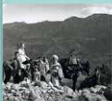
Prisonniers de guerre allemands déportés dans les Aurès (Algérie), photographié en 1943