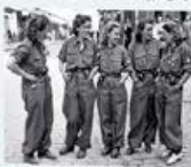
« Dix résistantes de la France libre... »