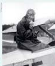
Le pilote française Maryse Bastié, photographée, 1911.