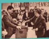
Des femmes déposent leur bulletin de vote lors d'une séance électorale municipale (Puteaux), avant de l'annonce des résultats. Photographie, photographie de presse, 1945.