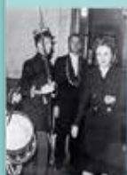
Eugénie Éboué-Tell, élue sénatrice de la Seine, élue sénatrice de la Haute-Guyane, élue sénatrice de la Martinique, élue sénatrice de la Guadeloupe, 1946.

Gilberte BROSSOLETTE (1905-2004) Eugénie ÉBOUÉ-TELL (1891-1972)