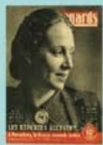
« Les déportées d'Auschwitz et Ravensbrück », 1964.

Arrêtée le 9 février 1942, elle est internée à la prison de la Santé puis au fort de Romainville avant d'être déportée à Auschwitz le 27 janvier 1943, puis transférée à Ravensbrück. Libérée le 30 avril 1945, elle revient en France le 24 juin 1945 et s'investit dans la lutte contre l'oubli des crimes nazis. Le 26 janvier 1946, elle témoigne au procès de Nuremberg. Elle poursuit son engagement politique en siégeant aux deux Assemblées constituantes en 1945 et 1946, puis en étant élue députée communiste de la Seine (1946-1958), puis de Vaucluse (jusqu'en 1973). Elle occupe également les fonctions de vice-présidente de l'Assemblée nationale entre 1958-1959 et 1967-1968. En parallèle, elle défend la notion d'imprescriptibilité des crimes contre l'humanité devant l'Assemblée nationale en 1964 et s'engage dans le procès de Klaus Barbie en 1987. Enfin, elle joue un rôle majeur dans la création de la Fondation pour la mémoire de la déportation en 1990, qu'elle préside jusqu'à sa mort le 11 décembre 1996.