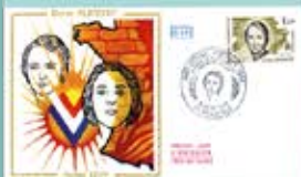
Berty Albrecht, Résistante, Compagnon de la Libération (Photo : Berty Albrecht, 2012)