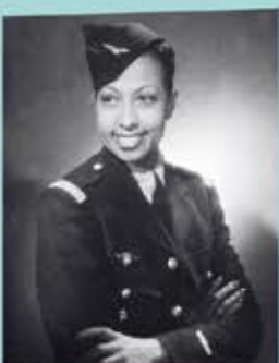
Josephine Baker, photographiée au Sud-Est de France, 1944.

Josephine Baker est née le 3 juin 1906 à St Louis, aux États-Unis. Danseuse de renommée, elle connaît un immense succès à Paris et à travers l'Europe dans les années 1920 avec La Revue nègre au théâtre des Champs-Élysées. Devenue une icône des mouvements dadaïste et cubiste, elle utilise sa notoriété pour combattre le racisme durant l'entre-deux-guerres. Ayant adopté la nationalité française en 1937, en signe de gratitude envers son pays d'accueil, elle met sa célébrité au service de la France dès le début de la Seconde Guerre mondiale, donnant à sa célèbre chanson J'ai deux amours une portée patriotique. Après la défaite, elle rejoint la France libre en tant qu'agent de renseignement et s'engage activement auprès de l'armée pour soutenir le moral des soldats. Après le débarquement anglo-américain en Afrique du Nord le 8 novembre 1942, elle est nommée sous-lieutenant dans l'armée de l'air en mai 1944. À la Libération, elle est décorée de la Légion d'honneur et de la médaille de la Résistance avec rosette. Après la guerre, Josephine Baker consacre sa vie à la lutte contre toutes les formes d'intolérance. Elle s'éteint le 12 avril 1975, recevant des honneurs militaires lors de ses funérailles. En reconnaissance de son engagement, elle est solennellement inhumée au Panthéon le 30 novembre 2021.