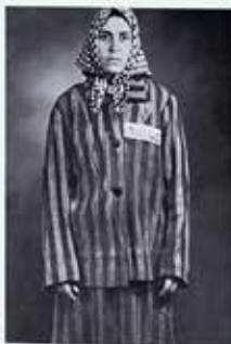
Neus Català i Pallejà en tenue de déportée (France), photo/photographie, 1943

Neus Català i Pallejà, née le 6 octobre 1915 en Catalogne, est une figure emblématique de la lutte antifasciste espagnole. Infirmière de formation, elle s'engage dès la guerre civile espagnole aux côtés des Républicains. Après leur défaite en 1939, elle se réfugie en France, puis elle rejoint la Résistance. En tant qu'agent de liaison, ses missions consistent à livrer des messages et transporter des armes. Sa maison sert de lieu de rencontre aux groupes de résistants vivant dans le maquis et aux déportés du Service du travail obligatoire (STO). En 1944, elle est arrêtée par la Gestapo à Limoges et subit de terribles tortures avant d'être déportée au camp de Ravensbrück. Durant sa déportation, elle s'illustre par sa solidarité avec les autres prisonnières et sa participation à des actes de résistance clandestins au sein du camp. Libérée en 1945, elle ne cesse de lutter contre les régimes oppressifs. De retour en Espagne, Neus Català i Pallejà poursuit son combat contre la dictature franquiste, notamment à travers des activités clandestines et son engagement politique. Jusqu'à sa mort en 2019, à l'âge de 103 ans, elle témoigne inlassablement des horreurs du nazisme et du franquisme, rappelant l'importance de la mémoire et de la résistance face à la barbarie. Figure de courage et de résilience, elle laisse un héritage puissant dans la lutte pour la liberté et la justice.