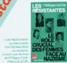
« Les Résistantes... »