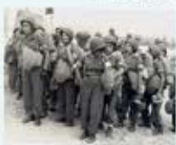
Débarquement des volontaires du Corps féminin des transmissions, 1944 (19 ans).

« J'ai été le chef de ces valeureuses filles, Je les ai connues, encouragées, admirées et pleurées. »