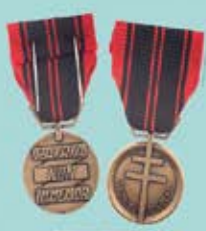
Médaille de la Résistance et Médaille de la France combattante, attribuées à Marie-Madeleine Fourcade en 1945.