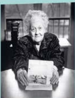
Germaine Tillion Musée de l'Homme, Paris, le 2008

Germaine Tillion, née le 30 mai 1907, a été une figure avant-gardiste. Après avoir obtenu son diplôme d'ethnologie, elle réalise une mission scientifique de six ans dans les Aurès, en Algérie. De retour en France en juin 1940, elle refuse de se soumettre à l'Armistice et rejoint la Résistance. Elle s'engage dans un groupe d'aide aux prisonniers de guerre, en particulier les prisonniers coloniaux, et établit des connexions entre plusieurs réseaux, notamment celui du Musée de l'Homme, tout en rassemblant des renseignements. Lorsque la majorité des membres de son groupe est emprisonnée, elle en prend la tête. Arrêtée en 1942 à Paris où elle préparait l'évasion d'un résistant, elle est déportée à Ravensbrück en 1943. Après la guerre, des 1946, elle milite contre les camps de concentration, puis en 1954, elle part en mission officielle en Algérie, où la guerre vient de commencer, pour étudier la condition des civils. Elle y crée des structures sociales pour combattre la pauvreté et dénonce la pratique de la torture. Elle s'engage aussi dans la lutte contre l'esclavage contemporain. Germaine Tillion s'est éteinte en 2008, après avoir consacré sa vie à défendre l'égalité entre les peuples. En mai 2015, elle est inhumée au Panthéon, hommage à son parcours de vie exemplaire et à son engagement.