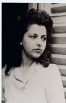
Madeleine Riffaud, photographiée l'été suivant l'occupation, en Libération, 1944.

Née en 1924, Madeleine Riffaud s'engage dans la Résistance à 18 ans. Elle rejoint les Francs-tireurs et partisans (FTP) sous le nom de « Rainer », un groupe de résistants engagés dans des actions armées contre les forces d'occupation. Elle est chargée d'assurer des liaisons, de porter des messages, de transporter des armes, de voler des tickets de rationnement dans les mains et des fiches du STO pour soustraire des étudiants. De sa propre initiative, en réaction au massacre d'Oradour-sur-Glane, elle abat un officier allemand et est arrêtée. Torturée par la Gestapo, elle refuse de trahir ses camarades, et est condamnée à mort. Elle est finalement libérée au cours d'un échange de prisonniers avec les Allemands. Après sa libération, Madeleine Riffaud participe activement à l'insurrection de Paris en août 1944. Elle rencontre Paul Eluard, avec lequel elle noue une amitié précieuse, qui l'encourage à écrire. Poétesse, elle se consacre ensuite au journalisme de guerre. Anticolonialiste, elle couvre la guerre d'Algérie et la guerre du Vietnam. Elle continuera toujours de défendre les valeurs de justice et de liberté.