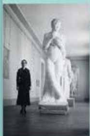
Rose Valland dans l'exposition « Les œuvres d'art volées pendant la Seconde Guerre mondiale », au Grand Palais, à Paris, le 10 septembre 1945.