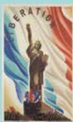
« Dix résistantes de la France libre... »