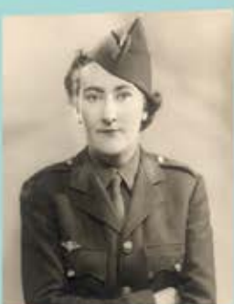
Simonne Mathieu, en uniforme, 1944. Photographie, 2014.