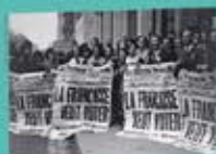
Manifestation féminine pour le droit de vote des femmes organisée par la Femme résistante par les Citoyennes (Paris), photographiée de presse, 1944.

Le rôle central joué par les femmes dans la Résistance durant la Seconde Guerre mondiale marque un tournant décisif vers la reconnaissance de leurs droits politiques. En 1944, lors des élections au Conseil de la République, 23 femmes font leur entrée au Palais du Luxembourg, à la Haute Assemblée (actuel Sénat). La plupart d'entre elles sont issues de la Résistance et vivent dans des camps politiques à Fresnes.