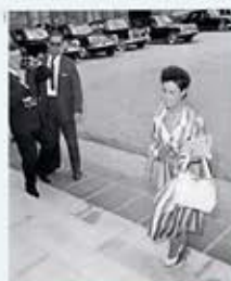
Andrée Viénot, secrétaire d'État, en conseil du Conseil des ministres (Paris), photographie, 1950.

Germaine Poinso-Chapuis (1901-1987) Andrée Viénot (1901-1976)