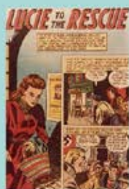
Lucie Aubrac dans le roman graphique de Lucie Aubrac et Raymond Aubrac, 1944