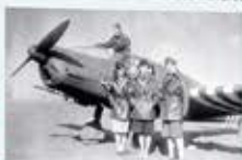
Sept membres des Forces armées françaises libres (FAFL) à l'aéroport de Saint-Petersbourg, 1943.

« J'ai deux amours, mon pays et Paris. »