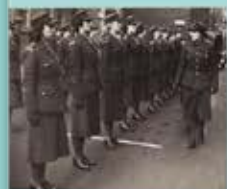
Équipe de footballeuses parisiennes en tenue de guerre, photographie de Louis Mouton, 1943. Photographie, 2014.