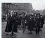
Eugénie Éboué-Tell, élue sénatrice de la Martinique, élue sénatrice de la Guadeloupe, 1946.

Eugénie Éboué-Tell voit le jour le 23 novembre 1891 à Cayenne, en Guyane, dans une famille créole modeste. Brillante élève, elle poursuit des études d'institutrice à Paris et devient l'une des premières femmes noires à obtenir un diplôme en France. Elle rencontre Félix Éboué, futur gouverneur et résistant, qu'elle épouse en 1922. Ensemble, ils s'installent en Afrique, où elle participe activement aux actions sociales et éducatives menées par son mari dans les colonies françaises. Pendant la Seconde Guerre mondiale, alors que Félix Éboué se rallie très tôt à la France libre du général de Gaulle, elle s'engage dans les Forces françaises libres (FFL) et sert comme infirmière à l'hôpital militaire de Brazzaville. Elle milite pour les droits des colonisés et pour l'égalité raciale, tout en jouant un rôle de premier plan dans les actions humanitaires et sociales menées en Afrique-Équatoriale française. Elle soutient également l'effort de guerre en favorisant l'organisation des résistances locales.