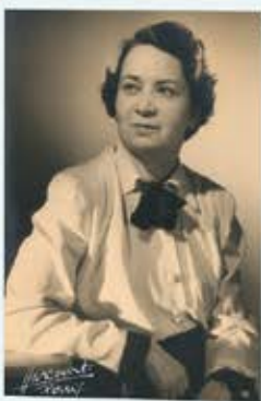
Yvonne Oddon, ethnologues de Musée de l'Homme (France), non datée

Yvonne Oddon, née en 1902 à Gap, est une figure marquante de la bibliothéconomie française et de la Résistance. Bibliothécaire au Musée d'ethnologie du Trocadéro, elle joue un rôle clé dans la modernisation des bibliothèques françaises, soutenant la modernisation des normes américaines d'organisation. Dès 1940, elle se distingue comme résistante en choisissant de rester au Musée de l'Homme malgré l'occupation allemande. Elle protège les collections et organise des envois de livres et vêtements aux soldats prisonniers. Elle fonde avec Boris Vildé et Anatole Lewitsky le réseau du Musée de l'Homme, l'un des premiers réseaux de résistance en France. Elle contribue également au lancement du journal clandestin Résistance et participe aux réunions secrètes avec Germaine Tillion. Arrêtée sur dénonciation par la Gestapo en 1941, elle est condamnée à mort en 1942, tout comme neuf de ses camarades du réseau. Sa peine est finalement commuée en déportation et elle est envoyée au camp de Ravensbrück puis à celui de Mauthausen. Libérée en 1945 par l'Armée soviétique, Yvonne Oddon revient au Musée de l'Homme en 1946.