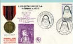
Un Ordre de la Résistance (1944) et l'Ordre de la Libération (1945) de la Résistance.