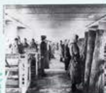
Dans le camp de concentration pour femmes (Auschwitz-Birkenau), photo/photographie, 1943

Danielle CASANOVA (1909-1943) Neus CATALÀ I PALLEJÀ (1915-2019)