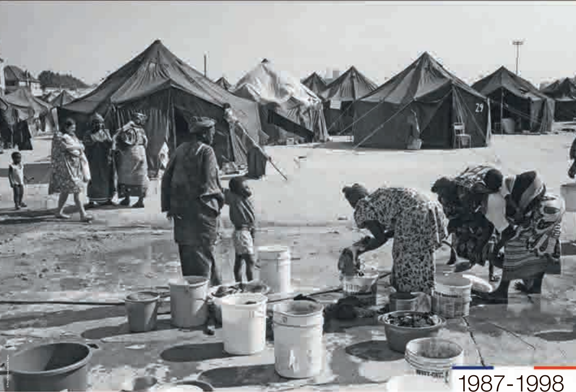
Camp de réfugiés sans-papiers, photographie de Pierre Michaud, non datée.