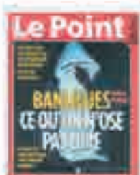
« Banlieues ce qu'on n'ose pas dire », couverture in Le Point , 2005 [novembre].