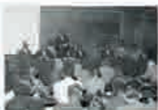
Allocation d'Alioune Diop au premier Congrès des écrivains et artistes noirs, 1956.