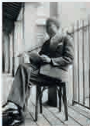
Léopold Sédar Senghor au lycée Louis-le-Grand à Paris, photographie, 1929.