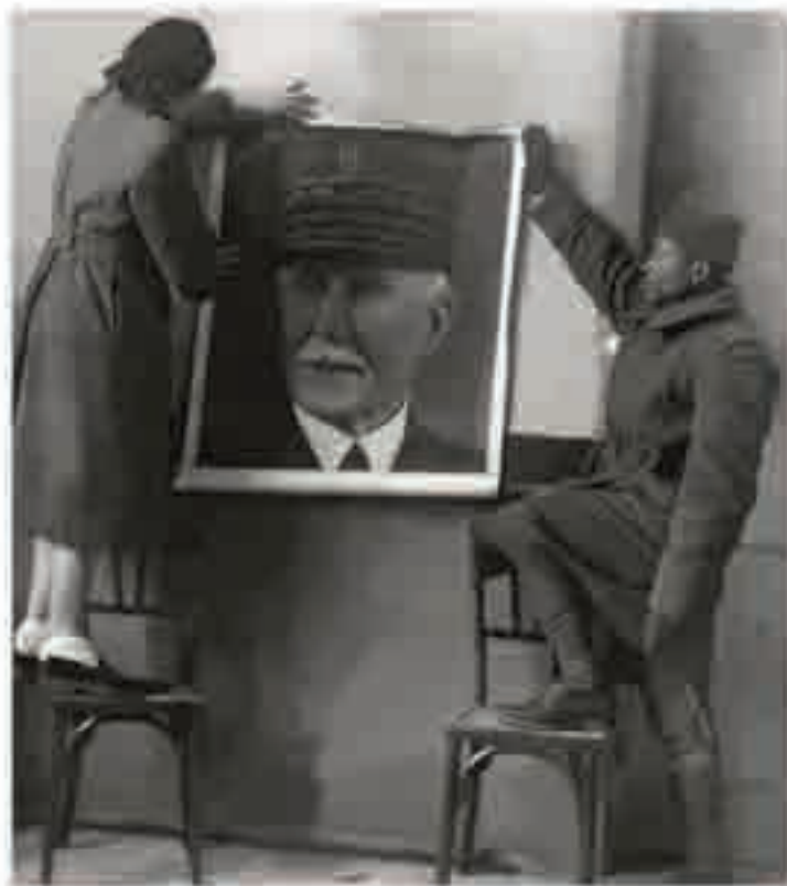
Association des amitiés africaines. Camp de Sathonay, photographie de propagande de l'AAA, 1942.