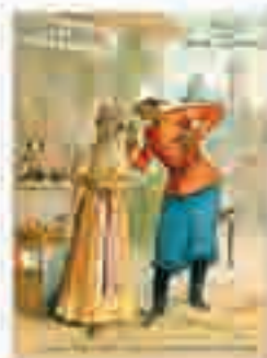
Exposition universelle. Guadeloupe, chromolithographie publicitaire pour la Maison de la Belle Jardinière, 1889.