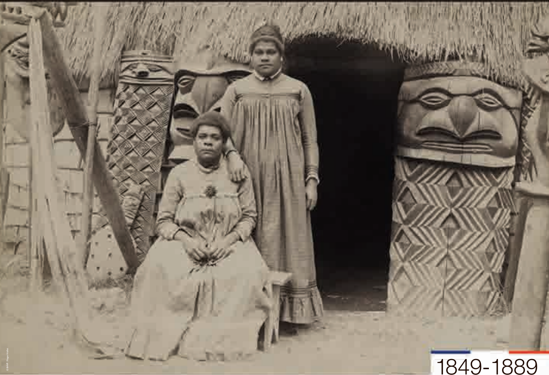
Exposition universelle de Paris. Deux femmes canaques, photographie, 1889.