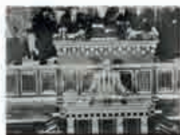
Gaston Monnerville, président du Sénat, photographie, 1965.