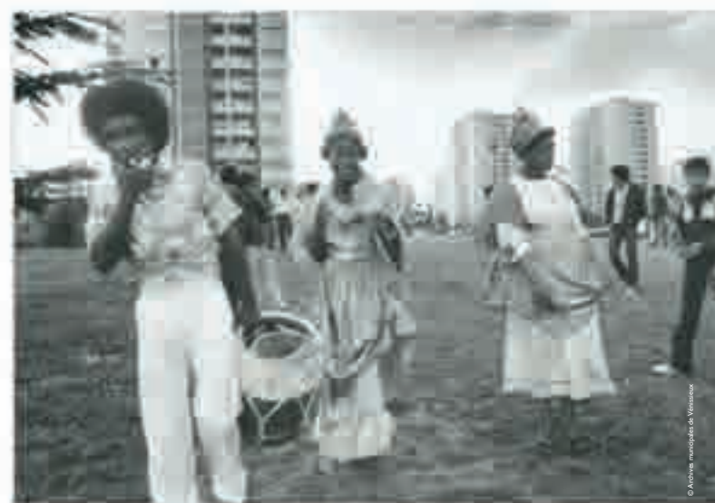
Nouveaux ensembles des Minguettes, la communauté antillaise [Vénissieux], photographie de Josette Vial, 1975.

« Tout homme est censé avoir été en France. Alors, soit pour faire des études, soit pour travailler, réunir un pécule [...]. Un homme vrai est celui qui a été en France. »