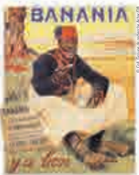
Banania, affiche signée De Andreis, créée en 1915.