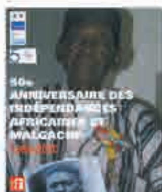
50 e anniversaire des indépendances africaines et malgaches, dépliant du programme, 2010.

Les troupes des anciennes colonies africaines de la France ont ouvert le défilé du 14 juillet 2010 sur les Champs-Élysées, cinquante ans après leurs indépendances. Un peu moins de cinq cents soldats africains ont défilé devant les autorités françaises et africaines et le public. L'événement est symbolique, mais souligne aussi la faiblesse des actions et événements pour cette année commémorative du 50 e anniversaire des indépendances des anciennes colonies de la France en Afrique qui ne resteront dans les mémoires qu'à travers de cet événement militaire.