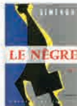
Le Nègre, couverture du roman de Georges Simenon, 1957.