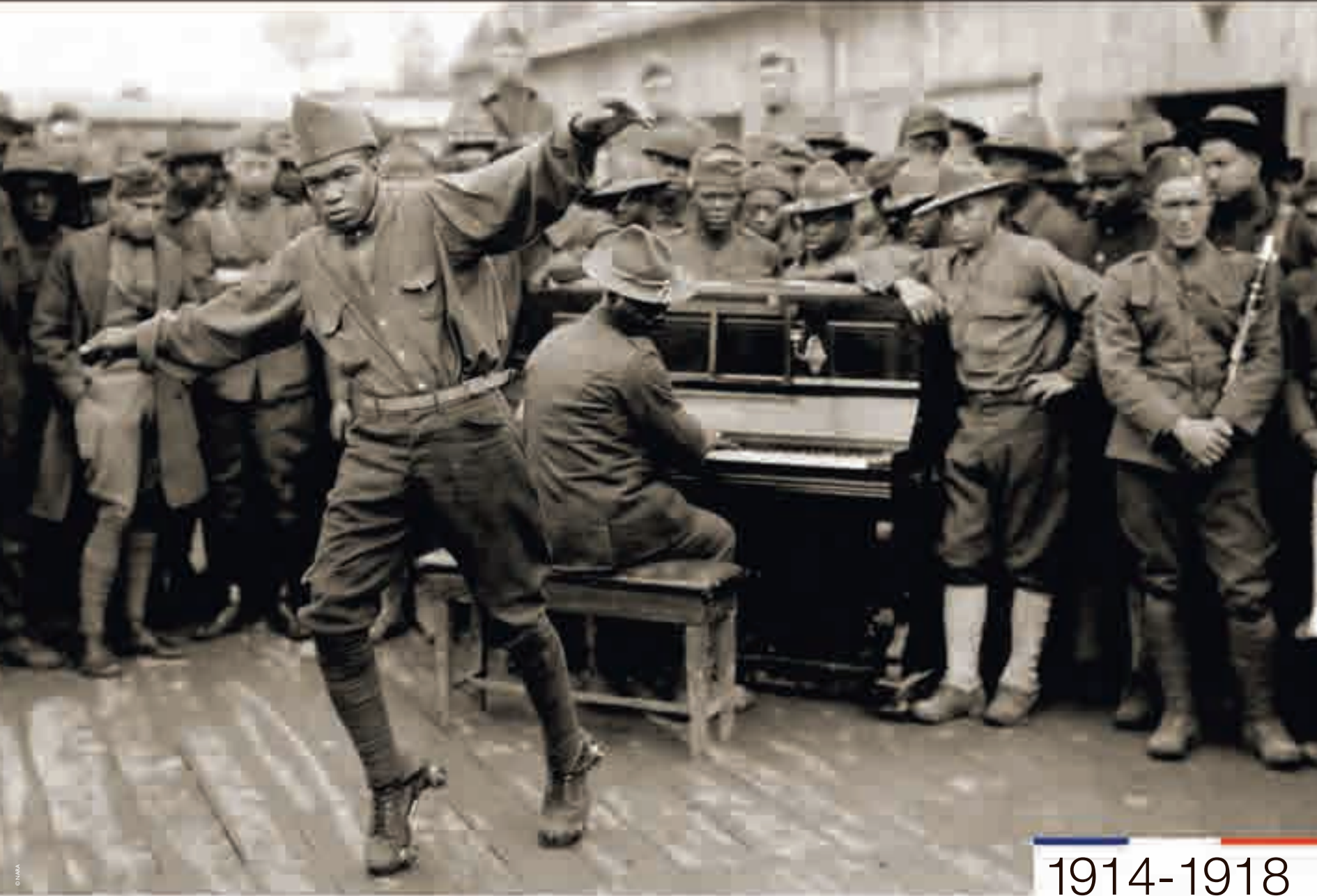
Entertaining the boys with fancy dancing on roller skates [Bordeaux], photographie de l'armée américaine, 1918.