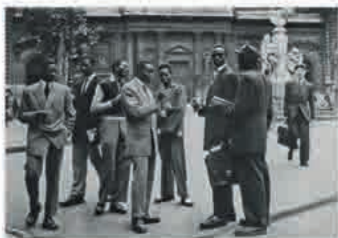
Étudiants africains devant la Sorbonne, photographie, c. 1955.

« Contribuer à faire entrer sur la scène de l'Histoire les intellectuels nègres, africains et antillais »