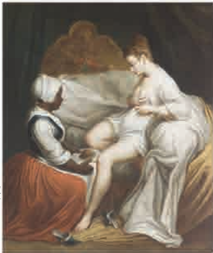
La toilette intime, huile sur toile signée Jean-Antoine Watteau, c. 1720.