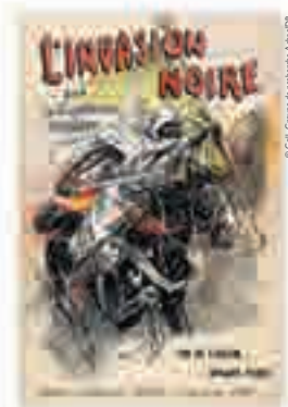
L'invasion noire, couverture du livre du capitaine Danrit, 1895.