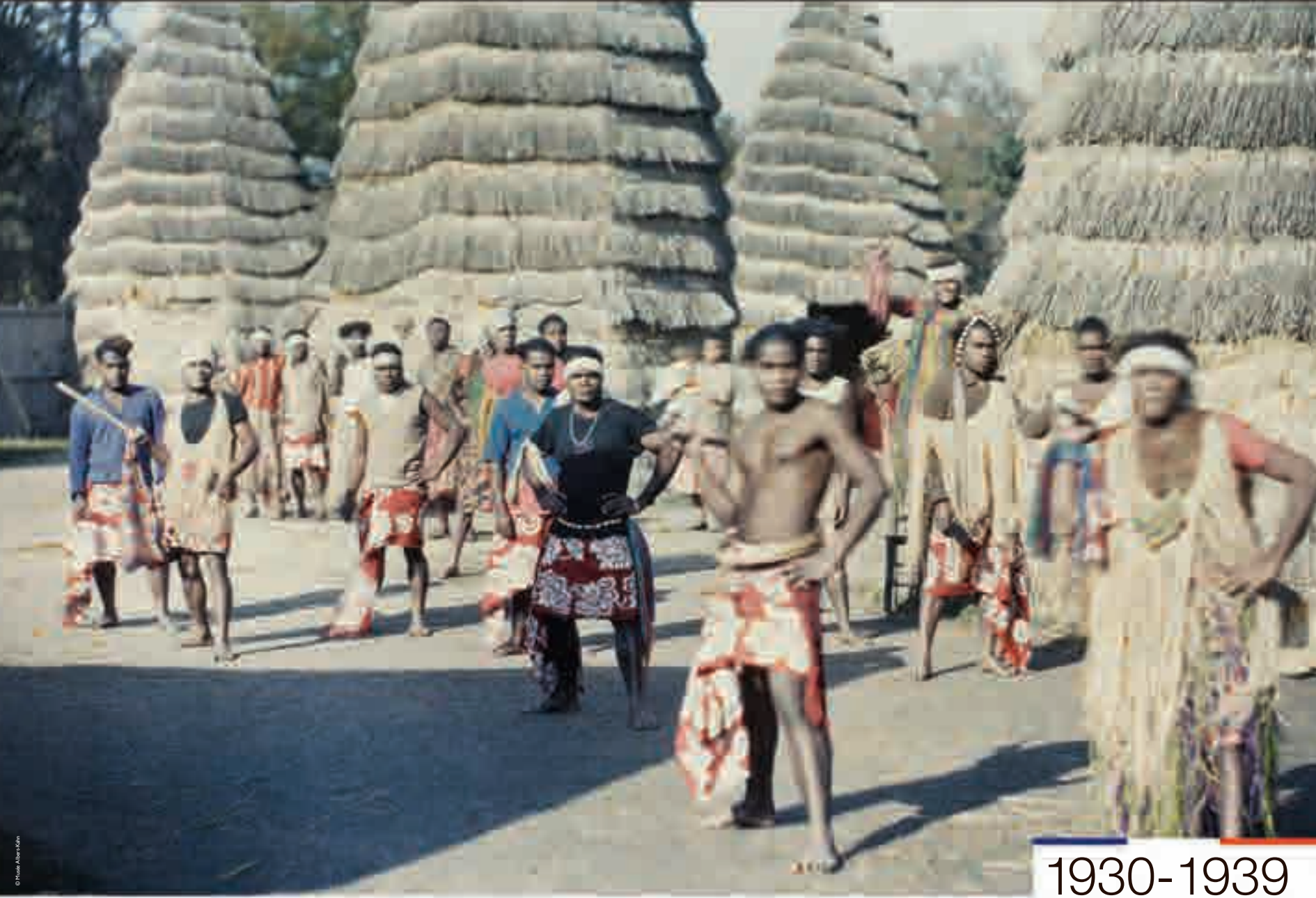
Village canaque de Nouvelle-Calédonie [Paris], photographie, 1931.