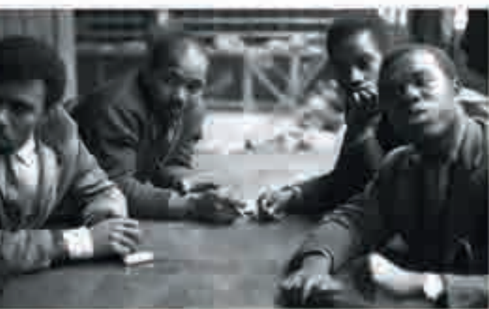
Travailleurs antillais aux PTT, 1964.

Gaston Monnerville est la personnalité politique ultramarine qui a obtenu le plus haut poste dans les institutions françaises au XX e siècle. D'origine guyanaise, il débute sa carrière politique comme député au lendemain d'un procès retentissant à Nantes (1932) pour défendre les « insurgés guyanais ». Il est ensuite nommé au poste de secrétaire d'État aux Colonies en 1937, après Blaise Diagne et Gratien Candace. Après guerre, il est élu au Sénat, avant de devenir président du Sénat de la Communauté (1959-1960) puis président du Conseil de la République et du Sénat jusqu'en 1968, le deuxième poste en niveau d'importance de la IV e République. Il entre dans l'opposition quand le général de Gaulle propose l'élection du président de la République au suffrage universel direct et appelle à voter François Mitterrand en 1965. Il termine sa carrière au Conseil constitutionnel.