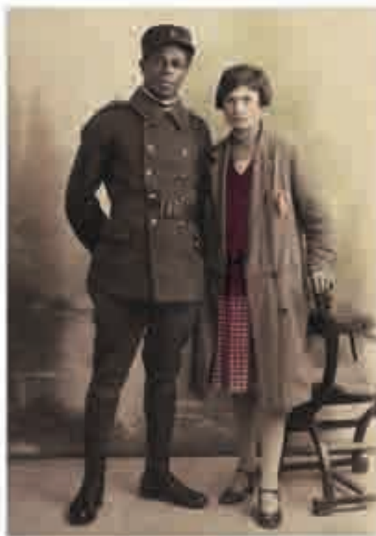
À Paris, un soldat colonial originaire des Antilles ou des « Quatre Communes » du Sénégal et sa compagne, photographie de studio, 1919.