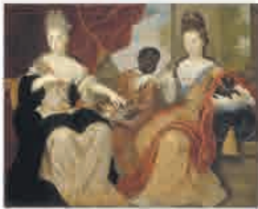
Mademoiselle de Blois et Mademoiselle de Nantes servies par leur domestique noir, huile sur toile signée Claude-François Vignon, 1697.