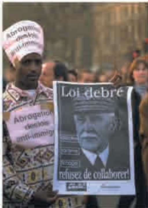
Manifestation contre la loi Debré à Paris, photographie, 1997.