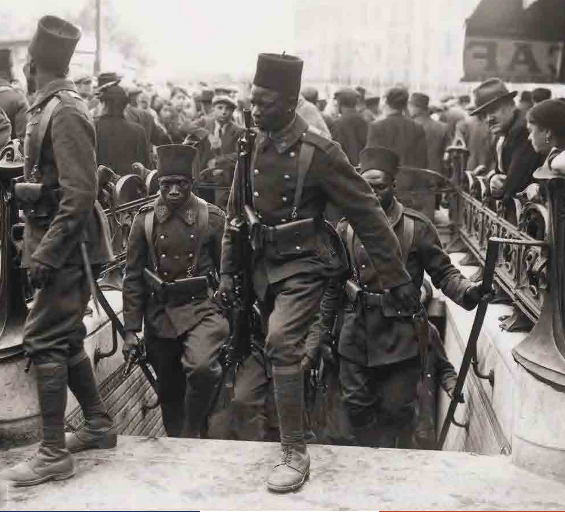
Le 12 e Régiment de tirailleurs sénégalais venu pour les cérémonies du 14 juillet, photographie de Meurice, 1939.