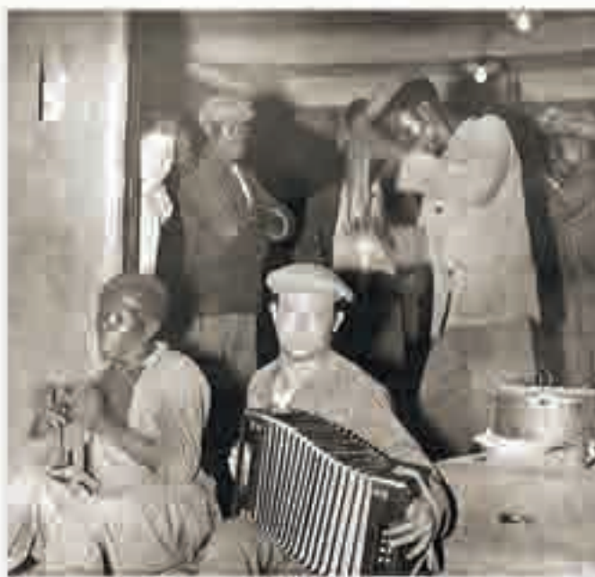
Dockers de la rue Torte [Marseille], c. 1925.