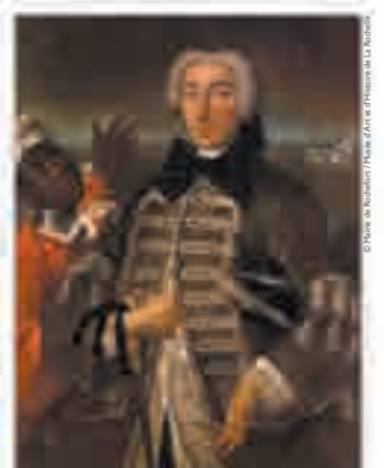
Portrait d'un officier de marine et de son esclave noir, huile sur toile de l'École française, c. 1750.