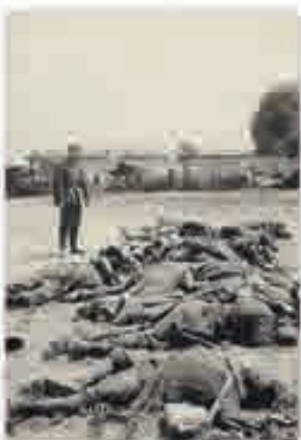
Corps de tirailleurs sénégalais après une exécution collective dans la Somme, photographie de source allemande, 1940.