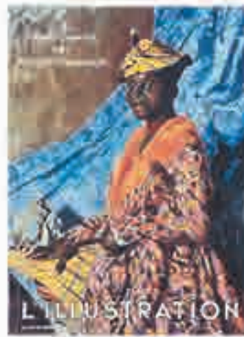
« Le Tricentenaire des Antilles françaises », couverture in L'Illustration , 1935 [novembre].