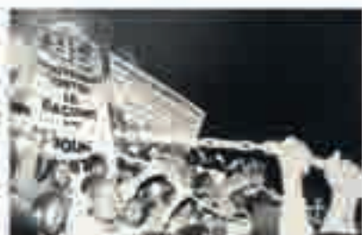
Mobilisation contre les expulsions [Paris], 1986.