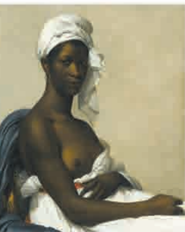
Portrait de négresse, peinture signée Marie-Guillemine Benoist, 1800.