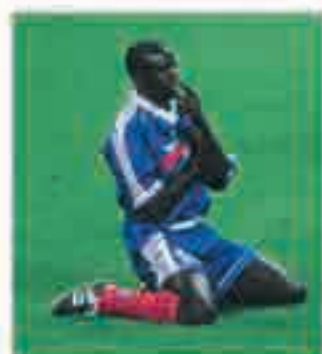
Lilian Thuram lors de la demi-finale France-Croatie, photographie, 1998.