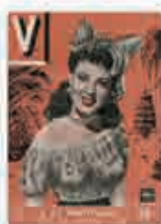
« La Martinique c'est ça qu'est chic », couverture in V, 1947.

Félix Houphouët-Boigny fonde en 1946, dans la future Côte d'Ivoire, le Rassemblement démocratique africain (RDA), puis il sera nommé membre de la Commission des territoires d'outre-mer et propose plusieurs projets de loi, dont un sur la suppression du travail forcé adopté en 1947. Il veut réviser en profondeur le système des colonies, et s'engage pour que les peuples africains comme antillais soient mieux représentés et puissent faire l'apprentissage de leur autonomie. Il sera plusieurs fois ministre sous la IV e République. Premier président de la Côte d'Ivoire, Félix Houphouët-Boigny tient un rôle majeur dans le processus de décolonisation de l'Afrique.