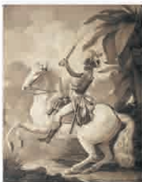
Portrait équestre de Toussaint Louverture sur son cheval Bel-Argent, peinture signée Denis A. Volozan, 1802.