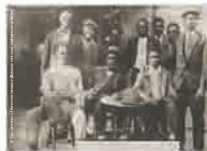
Groupe de Jazz à Marseille, photographie de Claude McKay, c. 1929