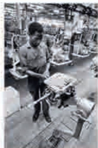
Ouvrier africain dans un atelier des usines Ford à Blaquefort, photographie de Richard Phelps Friedman, c. 1970.