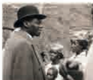
Blaise Diagne, homme politique d'origine sénégalaise, photographie, 1931.

BLAISE DIAGNE (1872-1934) Né en 1872 sur l'île de Gorée au Sénégal, Blaise Diagne est le premier député africain élu à la Chambre des députés française en 1914. Il obtient, pour les habitants des « Quatre Communes », la citoyenneté en échange de leur conscription en 1916. En 1917, le député Diagne s'indigne contre le fait que les troupes noires soient utilisées par Charles Mangin comme de la « chair à canon ». Pourtant, en 1918, il devient Commissaire général chargé du recrutement indigène en Afrique. En choisissant de soutenir l'entreprise coloniale de la France, il est nommé sous-secrétaire d'État aux Colonies au début des années 30 et, dans le cadre de ses fonctions, il inaugure l'Exposition coloniale internationale de 1931.