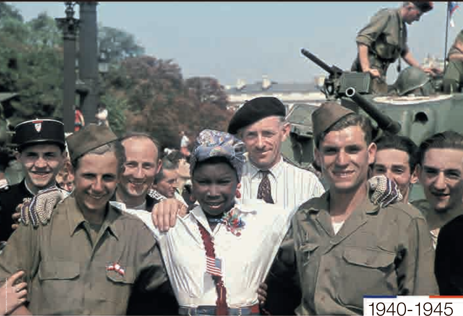
Libération de Paris, défilé du général de Gaulle, 1944.