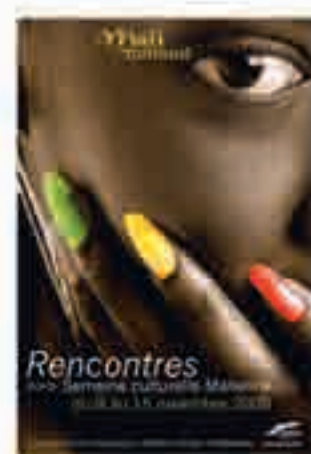
5 e semaine culturelle malienne de Montreuil, affiche signée Hyperbold, 2008.

« La seule chose qui change quand on a une origine africaine, c'est qu'on est noir, c'est visible. »