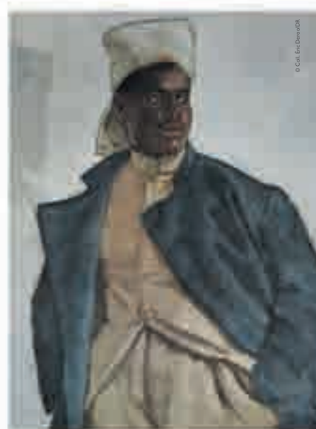
Guadeloupéen, peinture, c. 1917.

« Certains hommes se détachent de la foule et viennent nous serrer les mains. Je les entends dire : « Bravo les tirailleurs sénégalais ! Vive la France !... » »