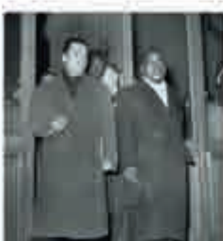
Félix Houphouët-Boigny et François Mitterrand, photographie, 1956.