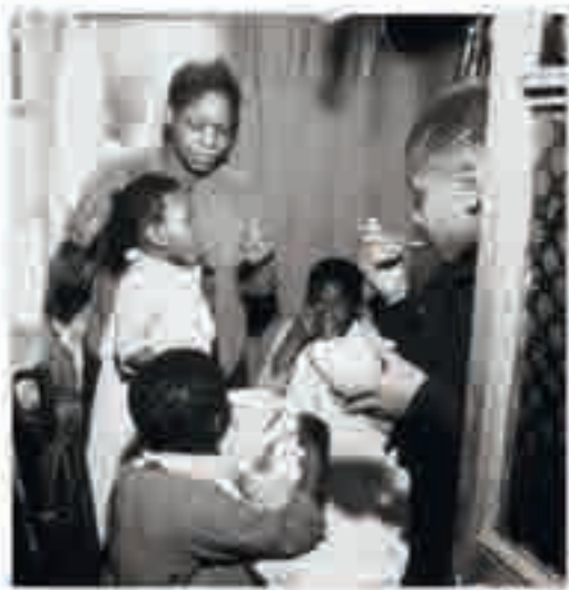
Famille africaine habitant dans un taudis à Paris, photographie, 1947.

Le Sénégalais Alioune Diop (1910-1980) crée en 1947 la revue Présence Africaine , véritable forum pour l'émergence d'une culture africaine indépendante. Elle devient un moteur intellectuel et offre une tribune aux figures noires du monde littéraire et politique tout en attirant l'adhésion de l'intelligentsia française. Il organise le premier Congrès des écrivains et artistes noirs à la Sorbonne, où des textes de Roger Bastide et Claude Lévi-Strauss sont lus en ouverture. Aimé Césaire en fixe la perspective politique : « Laissez entrer les peuples noirs sur la grande scène de l'Histoire. » Par son action, Alioune Diop assure une liaison féconde de créations entre toutes les diasporas noires.