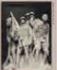
Monument aux héros de l'Armée noire détruit par les Allemands en 1940, photographie, non datée.

Inauguré le 13 juillet 1924 à Reims par Edouard Daladier, ministre des Colonies, ce monument porte les noms des principales batailles où les troupes africaines ont été engagées pendant la Première Guerre mondiale, et possède un double à l'identique à Bamako. Il fut détruit par les Allemands lors de la campagne de 1940 et, depuis 2008, plusieurs projets s'engagent pour le rebâtir afin de rendre hommage aux soldats noirs qui ont combattu pour la France.