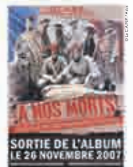
À nos morts, flyer de l'album du CAMP [Collectif d'Artistes pour une Mémoire Partagée], 2007.

« La voix la plus courte pour aller vers l'avenir est celle qui passe toujours par l'approfondissement du passé. »