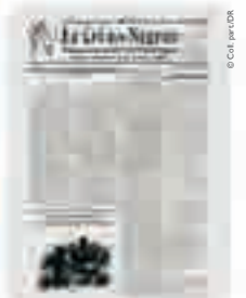
Le Cri des Nègres , Organe mensuel des travailleurs noirs, couverture, 1931.