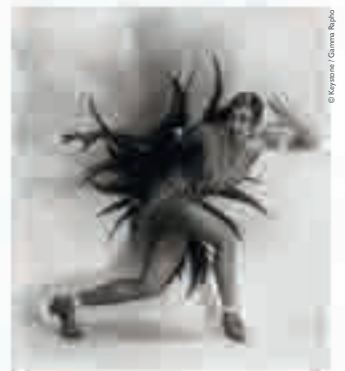
Joséphine Baker à Paris, photographie de studio, 1926.