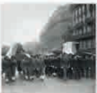
Transfert des cendres de Victor Schœlcher et de Félix Éboué au Panthéon, photographie, 1949.