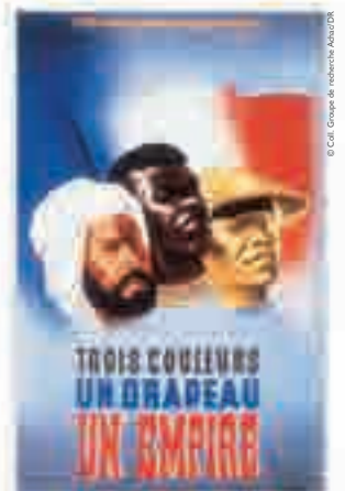
Trois couleurs, un drapeau, un empire, affiche signée Éric Castel, éditée par le secrétariat d'État aux Colonies, 1941.

« Nos compatriotes ont personnifié la France qui refuse d'être battue, la France qui refuse d'être esclave... »