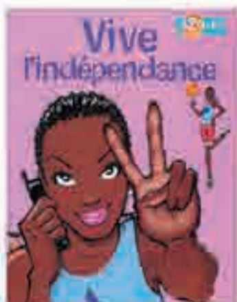
Vive l'indépendance , publicité pour Bouygues Telecom, 1998.