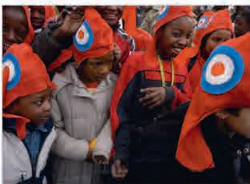
Cocarde et bonnets pendant le carnaval de Sarcelles, photographie de Xavier Zimbaro, 2005.