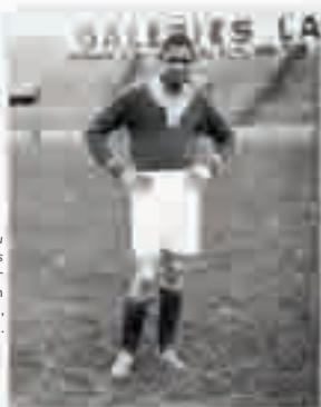
Raoul Diagne au Racing Club de Paris [premier joueur afro-caribéen en équipe de France], photographie, 1931.