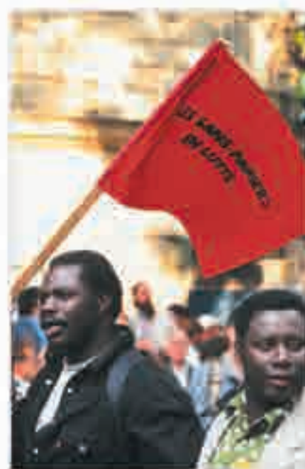
Manifestation de soutien aux sans-papiers [Paris], photographie de Jean-Michel Turpin, 1996.

« Je suis un homme divisé [...]. J'étais un pont brisé entre deux mondes. Une part de mon être était figée sur la rive orientale, tandis que l'autre vagabondait en Occident. »