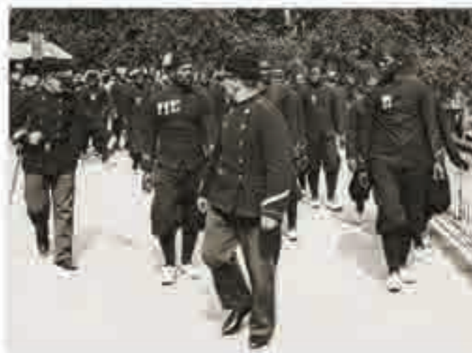
Défilé de tirailleurs à l'exposition universelle, photographie, 1900.

« Allez visiter le village nègre, considérez les Noirs car vous les verrez à l'état de nature, ils vivent comme chez eux. [...] visitez-les comme une attraction curieuse. »