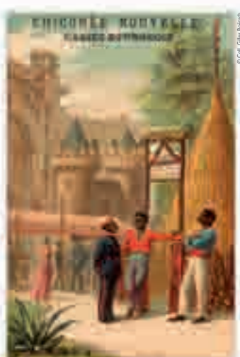
Calédonie, chromolithographie pour la Chicorée Nouvelle, 1889.