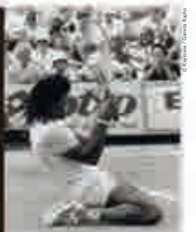
Yannick Noah après sa victoire en finale de Roland-Garros, photographie, 1983.

Né à Sedan, d'un père camerounais et d'une mère française, il est le symbole de la réussite des nouvelles générations et d'une « France métisse ». Sa victoire aux Internationaux de tennis de Roland-Garros en juin 1983 est un véritable événement populaire. Sa reconversion en tant que capitaine de l'équipe de France est un nouveau succès puisqu'il remporte la Coupe Davis en 1991 et 1996, puis la Fed Cup en 1997. Chanteur, impliqué dans différentes associations caritatives, il est aujourd'hui la « personnalité préférée » des Français.