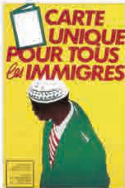
Carte unique pour tous les immigrés, affiche de la Cimade, 1982.