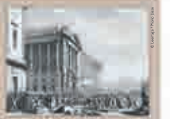
Pillage des armes au garde-meuble royal, place de la Concorde, gravure, 1789.

Situé place de la Concorde, ce bâtiment achevé en 1774 servait à l'origine de garde-meuble royal avant d'abriter, à compter de 1789, le ministère de la Marine. En 1848, y fut rédigé le texte préparatif à la loi sur l'abolition de l'esclavage initié par Victor Schoelcher, sous-secrétaire d'État à la Marine.