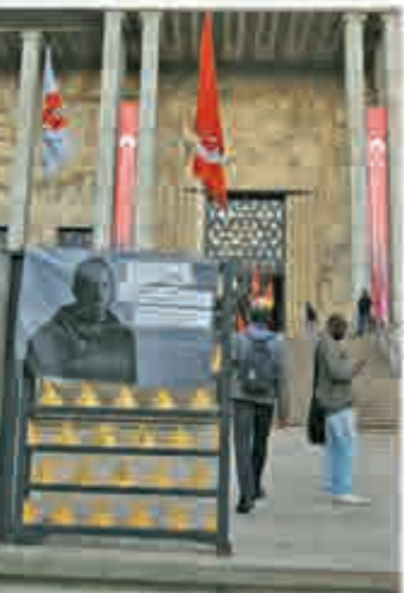
Occupation de la Cité nationale de l'histoire de l'immigration par des sans-papiers [Paris], photographie de Benoît Le Gallic, 2010.