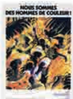
Nous sommes des hommes de couleur ! , affiche signée André Langevin, non datée.