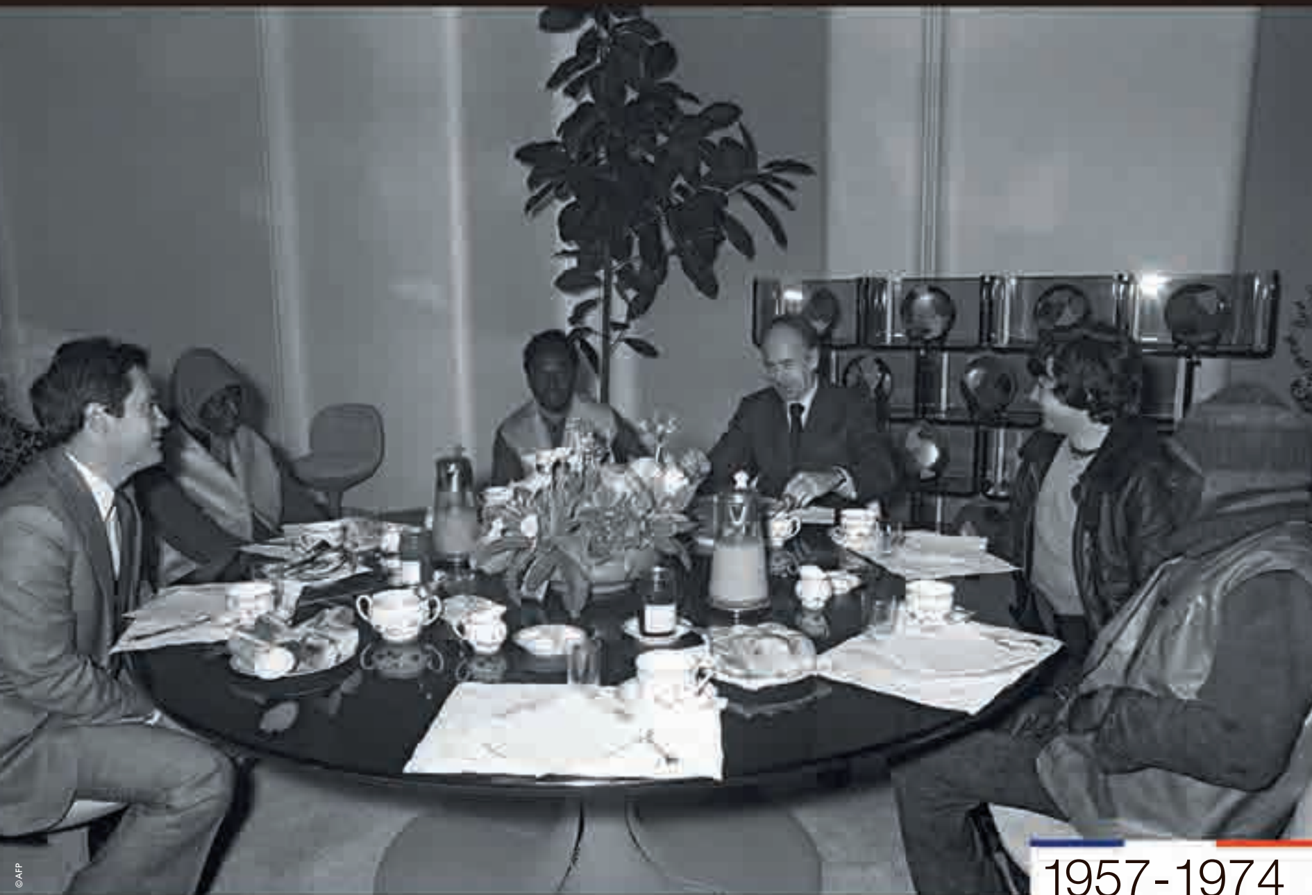
Le président de la République Valéry Giscard d'Estaing reçoit des éboueurs pour un petit déjeuner à l'Élysée, photographie, 1974.