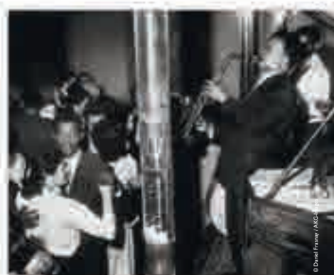
Orchestre de musiciens noirs au bal de la rue Blomet, photographie de Daniel Frasnay, 1955.