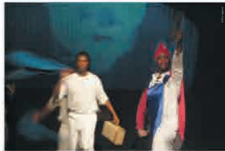
Vive la France ! de Mohamed Rouabhi [Théâtre Gérard-Philipe, Saint-Denis], photographie d'Éric Legrand, 2008.