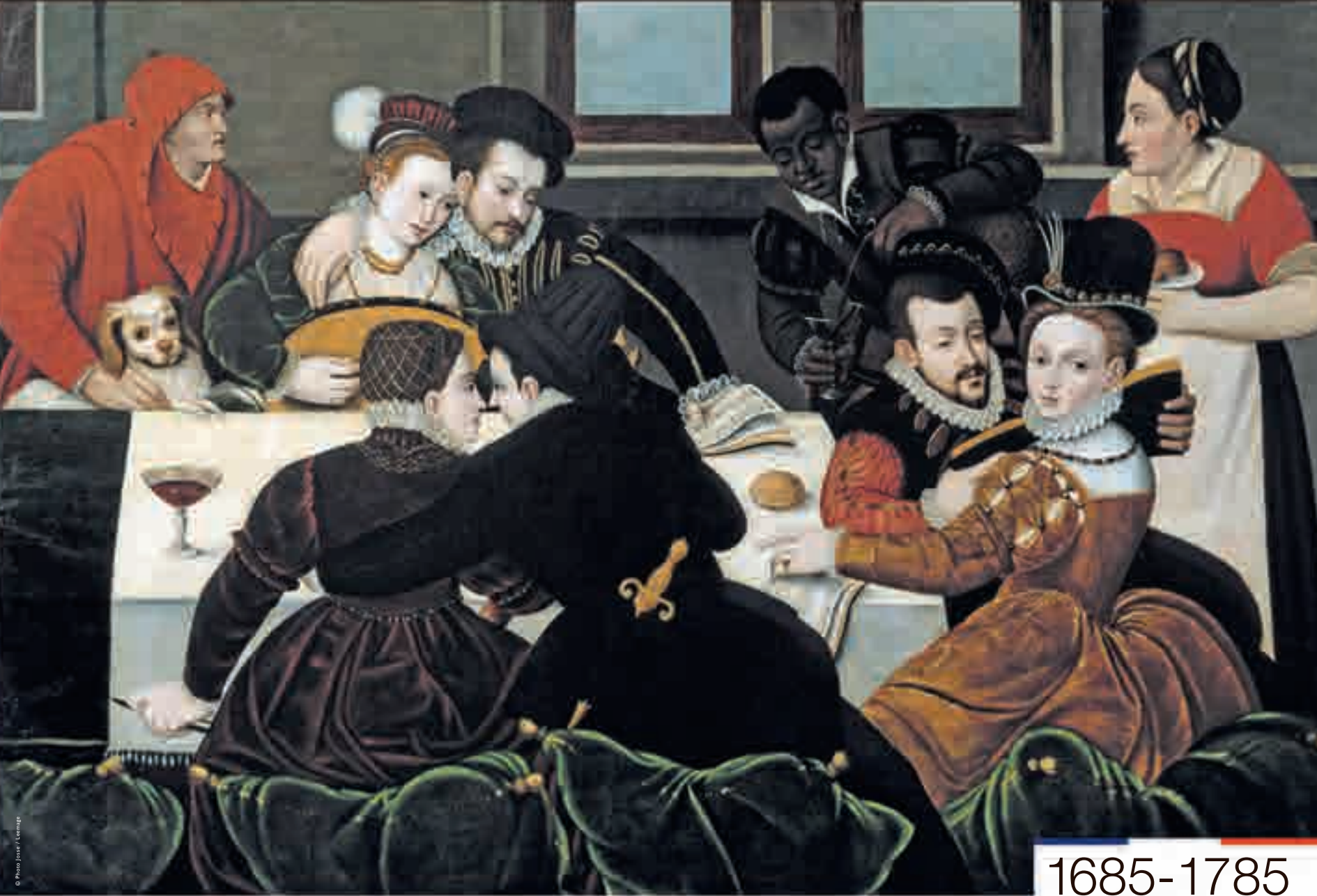
Le repas galant, peinture de l'École de Fontainebleau, c. 1540.