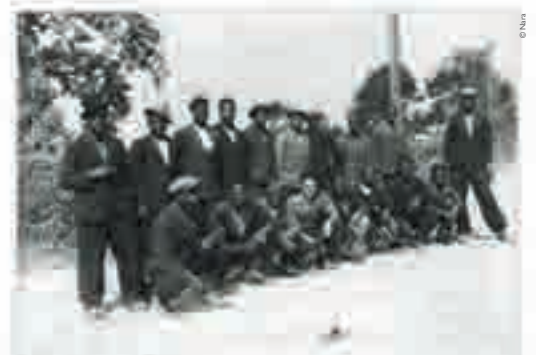
Groupes de travailleurs sénégalais évadés d'un bataillon allemand de travail ayant rejoint le maquis à Saint-Jean-aux-Bois, photographie, 1944.

Administrateur colonial d'origine guyanaise, il rallie la cause du général de Gaulle dès les premières heures de la Résistance. Quand s'annonce le Centenaire de l'abolition de l'esclavage, en 1948, le gouvernement décide de lui rendre hommage au Panthéon en compagnie de Victor Schœlcher. La cérémonie a lieu le 27 avril 1948. Gaston Monnerville rappela à cet instant que « c'est [un] message d'humanité qui a guidé Félix Éboué, et nous tous, Résistants d'outre-mer, à l'heure où le fanatisme bestial menaçait d'éteindre les lumières de l'esprit et où, avec la France, risquait de sombrer la liberté ».