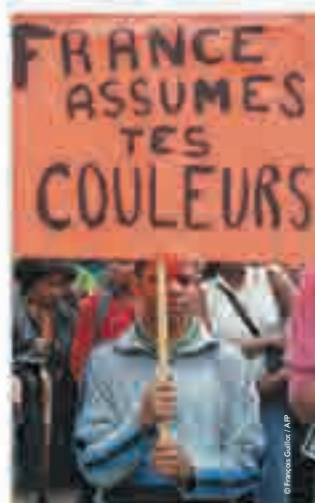
France assumes tes couleurs, photographie de François Guillot, 2000.