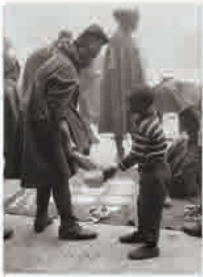
Partage de vivres [Marseille], photographie, 1913.