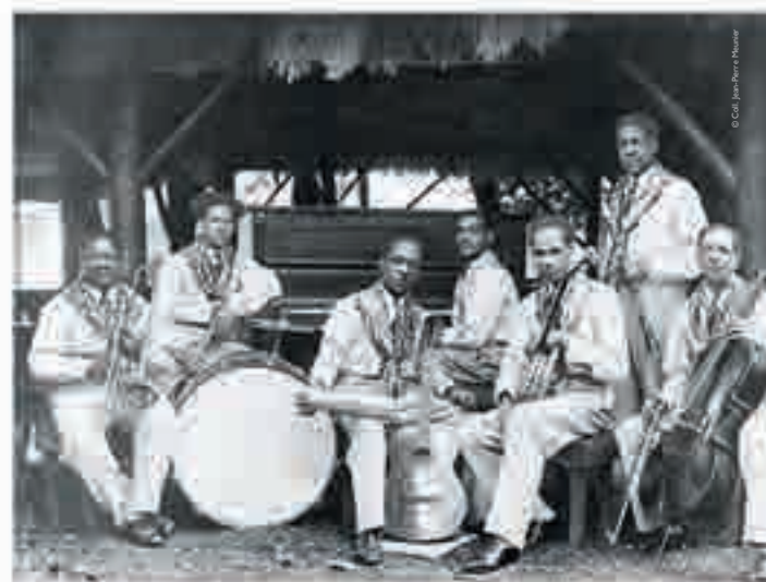
Orchestre Stelio de l'Exposition coloniale, photographie, 1931.

« On y trouve toutes les races, noire, jaune, blanche, mais c'est la noire qui domine. »