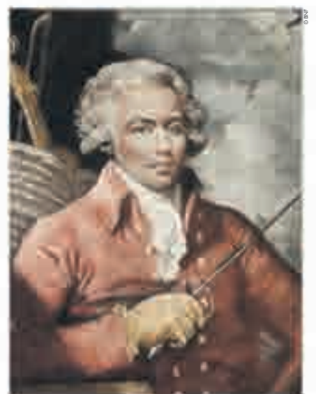
Joseph Bologne, chevalier de Saint-George, gravure signée Mather Brown, 1787.

Né en Afrique et vendu comme esclave à Saint-Domingue, il gagne sa liberté pour avoir servi dans l'armée lors de la guerre d'indépendance américaine. Élu député de Saint-Domingue en 1793, il contribue à faire voter la première abolition de l'esclavage. Il lutte contre l'indépendance de son île lors de la campagne contre Toussaint Louverture, il va participer activement à la répression, fidèle à son engagement anti-sécessionniste. De retour en France, il est incarcéré sous les ordres de Napoléon Bonaparte et meurt en captivité dans la forteresse de Belle-Île-en-Mer. Son portrait, réalisé par Anne-Louis Girodet en 1797, est la première représentation en France d'un homme noir dans une position officielle de législateur politique muni des codes de la fonction.