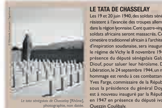
Le tata sénégalais de Chasseluy [Rhône], photographie, non datée.