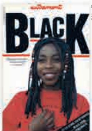
« Black: Africains, Antillais... Cultures noires en France », couverture in Autrement, 1983.