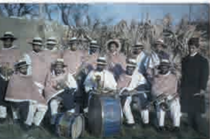
Groupe de Malgaches à l'exposition de Marseille, photographie, 1906.

Lègítimus, dessin de couverture signé Leal de Camara in L'Assiette au beurre , 1909.