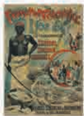
Exposition coloniale de Lyon. Villoges sénégalais et d'ahoméens, affiche signée Francisco Tamagno, 1894.