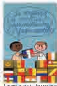
Je construis, tu construis... Nous construisons l'Afrique nouvelle, affiche signée Massacrier pour le ministère de la Coopération, 1962.

« Nous aimons Paris parce qu'on peut plus que chez nous dire ce qu'on pense. »