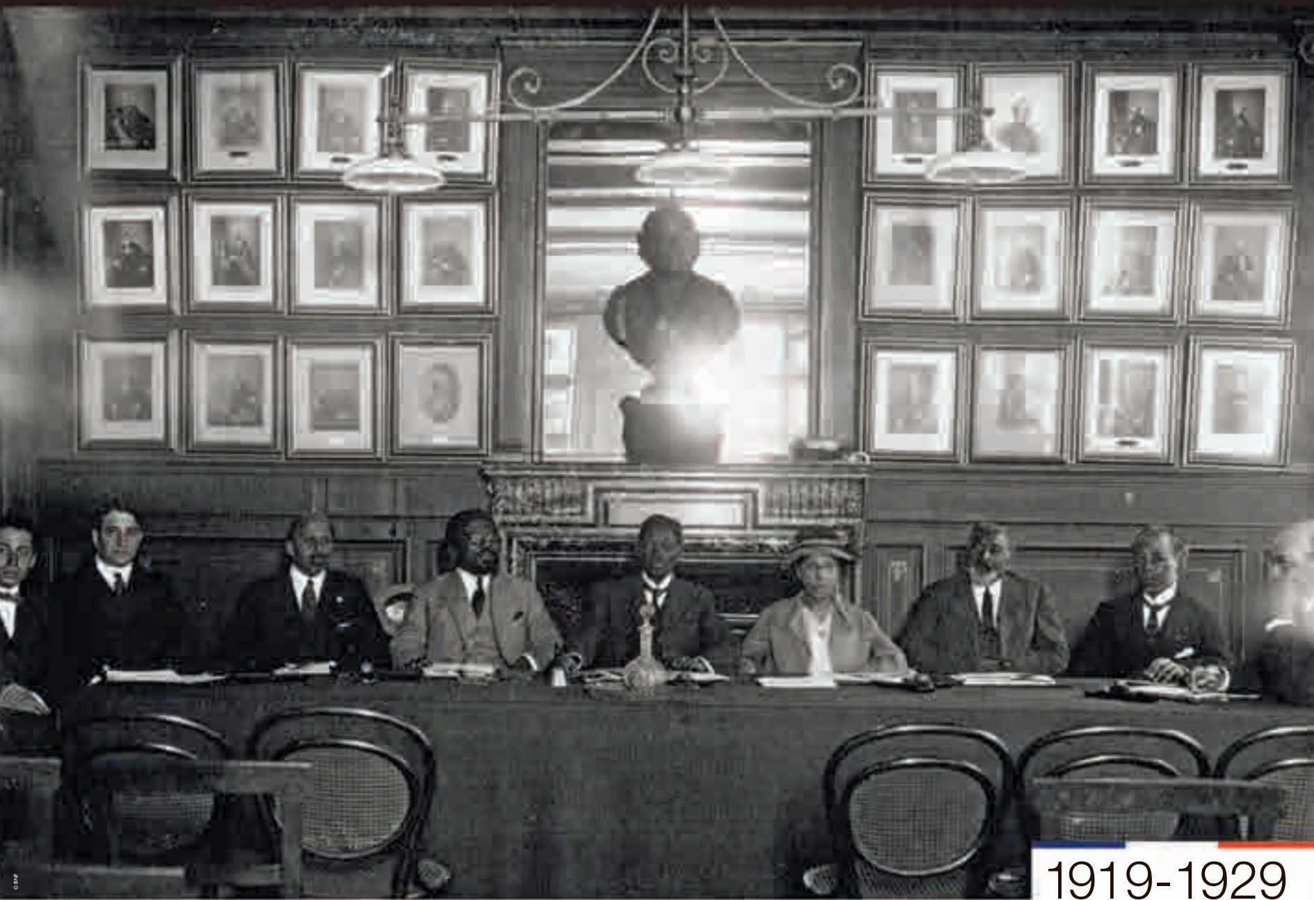
Deuxième congrès de la race nègre à Paris, photographie de l'agence Meurisse, 1921.