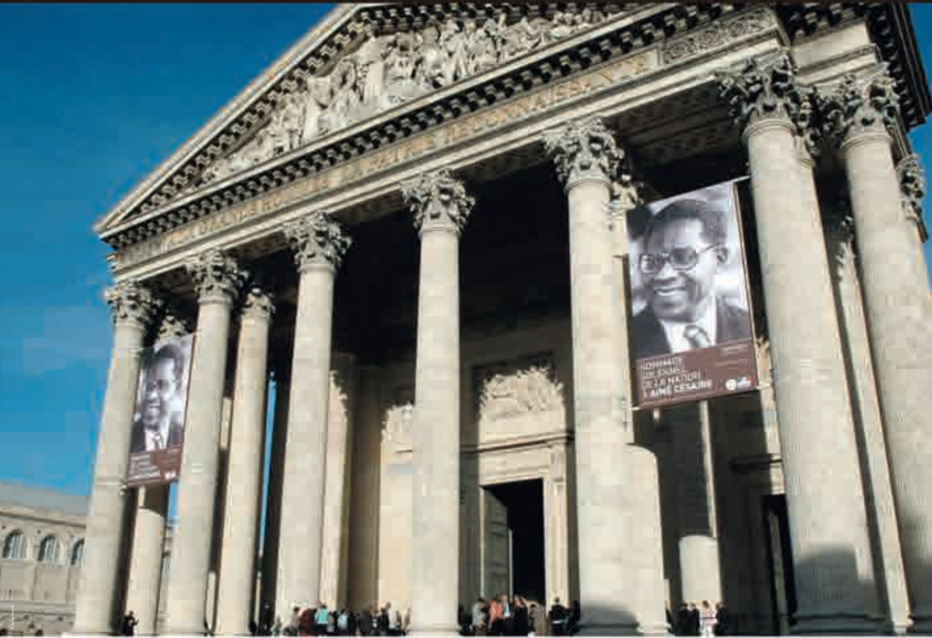
Hommage à Aimé Césaire au Panthéon, photographie de Brice Noreh, 2011.