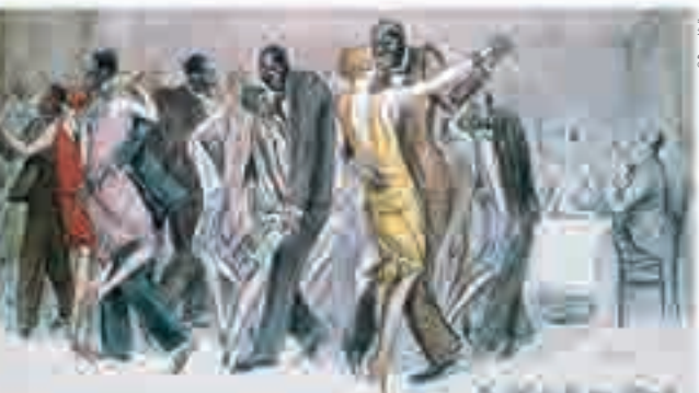
Le bal de la rue Blomet à Paris, aquarelle signée Sem, 1928.

En 1925, l'Afro-Américaine Joséphine Baker enflamme le public avec sa « danse nègre ». Presque nue, avec sa ceinture en « régime de bananes », sa gestuelle énergique mêle charleston et contorsions africaines. Son spectacle fait l'effet d'une « bombe » tant au niveau culturel que pour la représentation des Noirs en France et elle devient une star du public français. Personnalité du Tout-Paris et de la nuit, elle s'impose en France en tant qu'artiste noire, un statut que la ségrégation aux États-Unis lui interdisait.