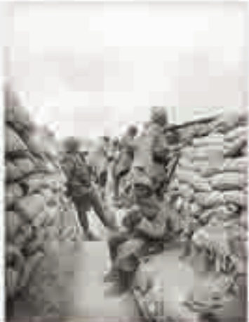
Tirailleurs sénégalais sur le front de l'Argonne [Champagne-Ardenne], photographie du Service photographique des armées, 1916.