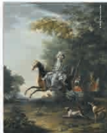
Marie-Antoinette chassant à courre, huile sur toile signée Louis-Auguste Brun, c. 1783.

« Octroyons aux affranchis les mêmes droits, privilèges et immunités dont jouissent les personnes nées libres... »