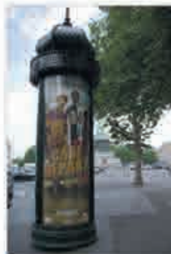
Case départ à l'effiche, photographie de Benoît Le Gallic, 2011.