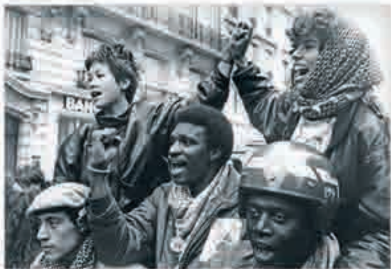
Marche contre le racisme à Paris, photographie de Christian Avril, 1983.