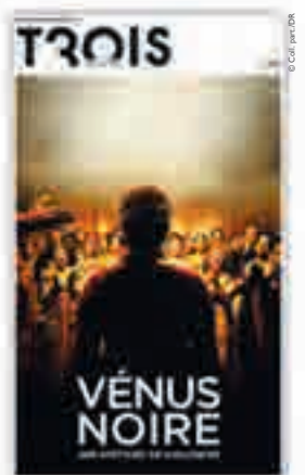
« Vénus noire. Une histoire de violences », couverture in supplément spécial Trois couleurs, 2010.