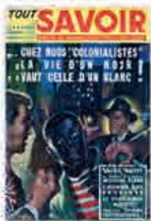
« Chez nous "colonialistes", la vie d'un Noir vaut celle d'un Blanc ! », couverture in Tout savoir, 1955 [décembre].