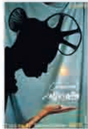
Cinéma d'Afrique, affiche du 5 e festival, 1995.