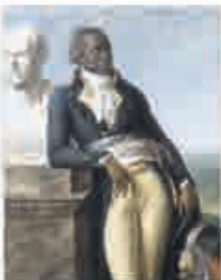
Portrait de Jean-Baptiste Belley, député de Saint-Domingue, peinture signée Anne-Louis Girodet de Roussy-Trioson, 1797.