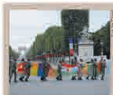
Répétitions du défilé du 14 juillet, photographie de Marie Babezy, 2010.