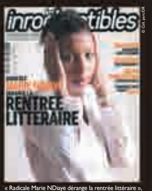
« Radicale Marie NDIAYE dérange la rentrée littéraire », couverture in Les Inroductibles , 2009 [solu].

Marie NDIAYE est une femme de lettres française, qui a obtenu le prix Goncourt en 2009 pour le roman Trois femmes puissantes et la seule femme écrivain vivante à avoir sa pièce de théâtre ( Papa doit manger ) au répertoire de La Comédie-Française . Fille de Sénégalais, elle refuse une association avec une identité africaine puisqu'elle a été éduquée dans un environnement complètement français. Néanmoins, elle s'est retrouvée face à l'impossibilité d'une neutralité « de posture » lorsqu'un député UMP lui demanda de modérer ses propos alors qu'elle avait ouvertement pris position contre la politique de l'immigration du président de la République Nicolas Sarkozy.