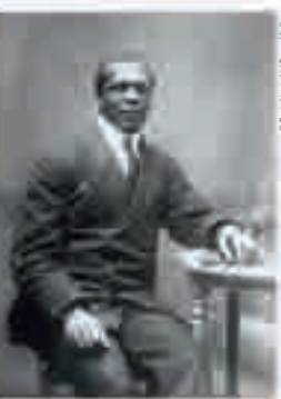
René Maran, 1914.

En 1921, le prix Goncourt est pour la première fois attribué à un auteur noir, le Martiniquais René Maran pour son œuvre Batouala . Véritable roman nègre. Tiré de son expérience d'administrateur des colonies dans l'Oubangui-Chari, il dénonce dans sa préface, le fait colonial, l'emploi des soldats noirs et les abus des colons français. Toute la presse française et internationale se déchaine. Batouala apparaît comme un acte précurseur de la lutte anti-coloniale.