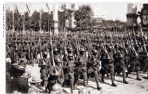
Les fêtes de la Victoire du 14 juillet. Troupes noires, carte postale, 1919.

BLAISE DIAGNE (1872-1934) Né en 1872 sur l'île de Gorée au Sénégal, Blaise Diagne est le premier député africain élu à la Chambre des députés française en 1914. Il obtient, pour les habitants des « Quatre Communes », la citoyenneté en échange de leur conscription en 1916. En 1917, le député Diagne s'indigne contre le fait que les troupes noires soient utilisées par Charles Mangin comme de la « chair à canon ». Pourtant, en 1918, il devient Commissaire général chargé du recrutement indigène en Afrique. En choisissant de soutenir l'entreprise coloniale de la France, il est nommé sous-secrétaire d'État aux Colonies au début des années 30 et, dans le cadre de ses fonctions, il inaugure l'Exposition coloniale internationale de 1931.