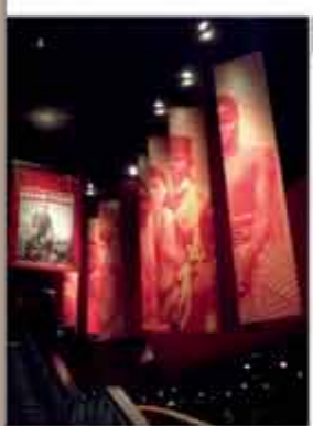
Exposition « L'Invention du Sauvage » présentée à la Fondation Lilian Thuram, 10 rue de Valenciennes, 75011 Paris.